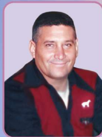
ALFA Y OMEGA, ENVIADO DEL DIVINO PADRE ETERNO, AUTOR DE LA CIENCIA CELESTE

Glorificad, a este hijo; que siendo humilde es grande ante vuestro divino Padre; tan grande, como para darle la divina telepatía; con cuyo divino Conocimiento, unificará al mundo; creando el sueño más inmenso; que han soñado millones de mis hijos humildes: El Gobierno Universal y Patriarcal; gobernando el de más sabiduría; el más perfecto modelo, a que haya llegado criatura alguna, en la interpretación de mi divina Palabra.-