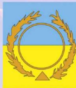
Divina bandera del milenio de paz