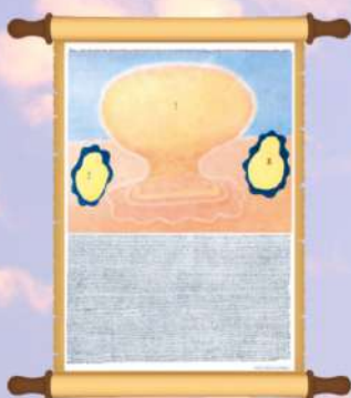
LOS ROLLOS DEL CORDERO DE DIOS ( apocalipsis 5)