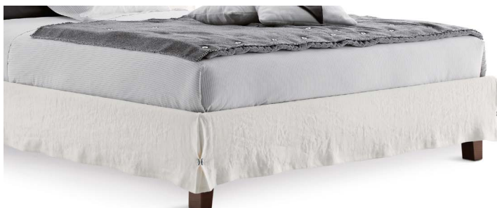
PIEDI LEGNO WOODEN FEET

+++ Indique los pies elegidos en el momento de la compra.