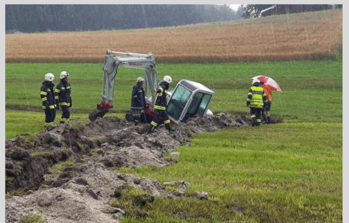
Starkregen im Juli