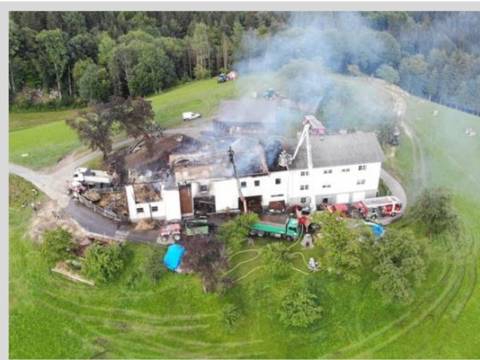
Brandeinsatz in St. Nikola