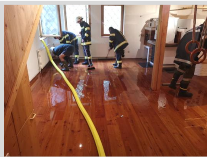
Überfluteter Keller im Juni