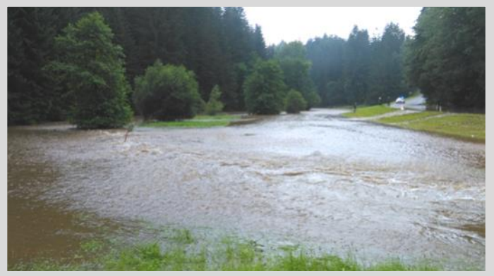
Starkregen im Juli

Die erbrachten Einsatzstunden unserer Kameraden belaufen sich auf 595 Mannstunden .