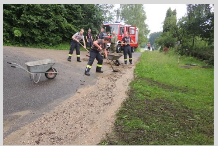
Starkregen im Juli