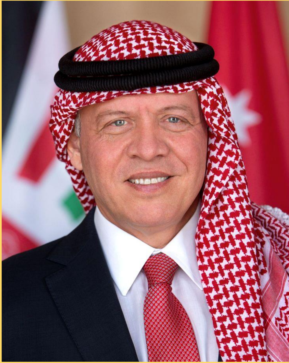
جلالة الملك عبدالله الثاني بن الحسين ملك المملكة الأردنية الهاشمية