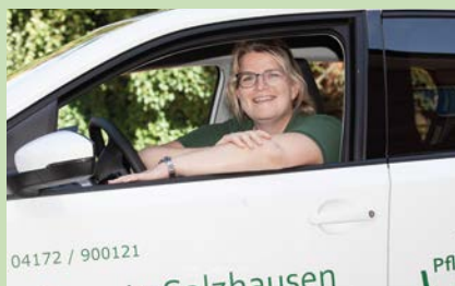
Der ambulante Pflegedienst für Salzhausen und Umgebung Tel.: 04172 / 90 01 21