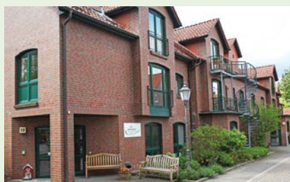
Das familiäre Senioren- und Pflegeheim mitten in Salzhausen Tel.: 04172 / 900 10