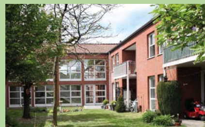
Die Seniorenwohnungen im Herzen von Salzhausen Tel.: 04172 / 98 20 10

Heidmarkhof Pflegen und Wohnen GmbH, Hauptstraße 6 B, 21376 Salzhausen