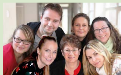
Die Tagespflege in häuslicher Atmosphäre Tel.: 04172 / 98 20 40