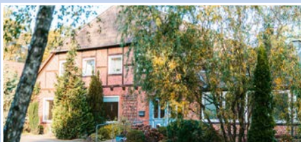
Haus am Berg