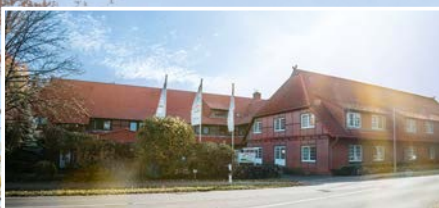
Haus im Dorf