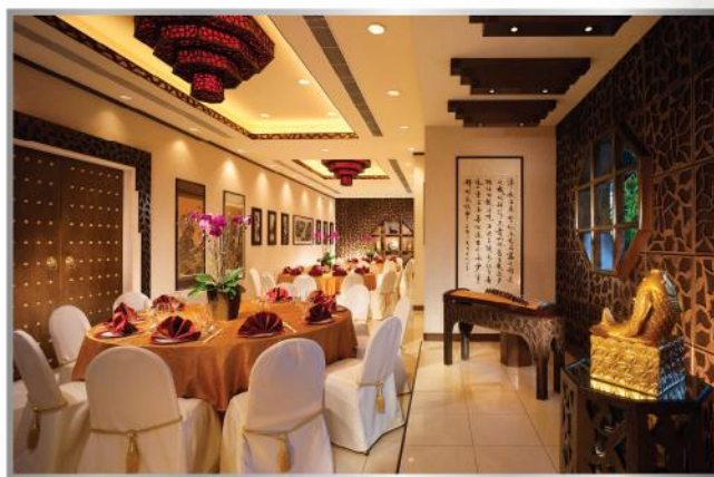
宴會廳 - 平面圖(700平方米)