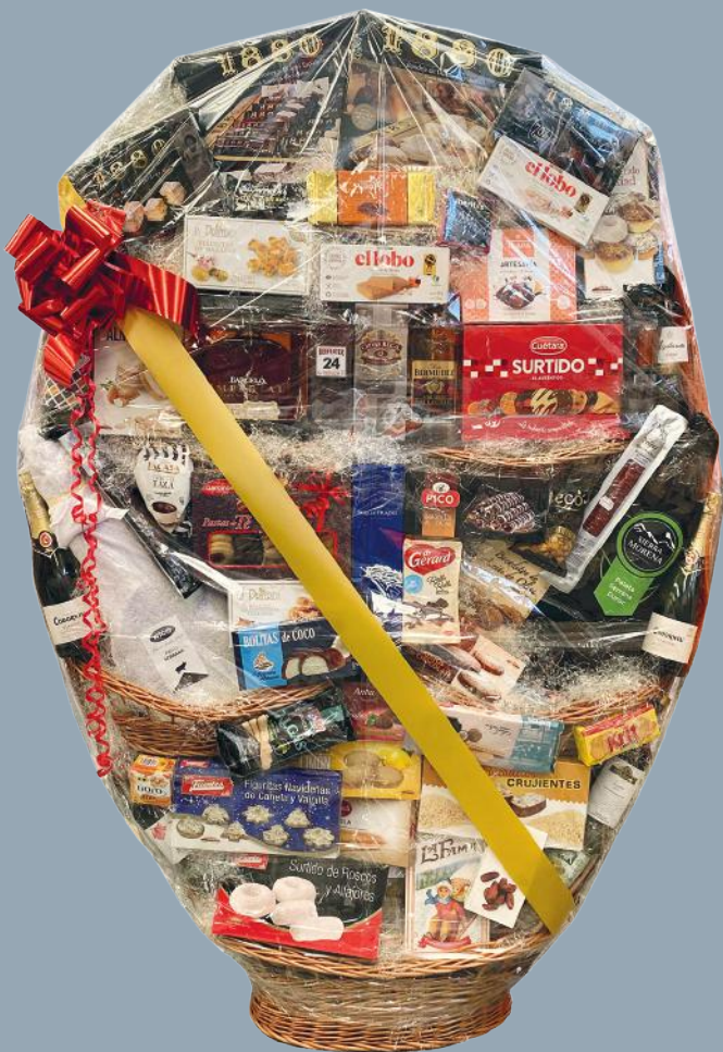
Muestra únicamente de presentación de la Cesta XXL, no de productos