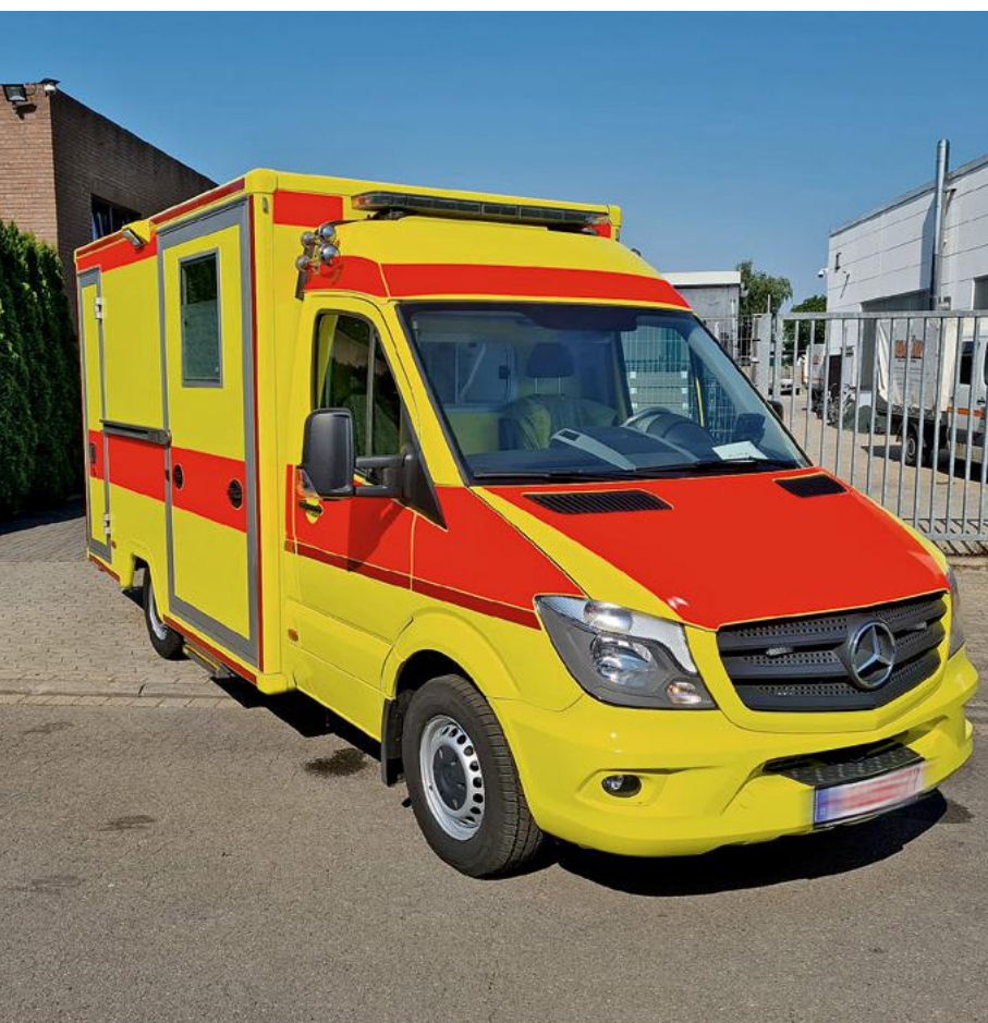
Naše týmy z Německa a Polska velmi úzce spolupracovaly na pořízení a přepravě sanitek na Ukrajinu.

Komplexní řešení pro humanitární pomoc. Jménem americké humanitární organizace zakoupil náš tým divize letecké a námořní přepravy sanitky, které Ukrajina naléhavě potřebuje, a přepravil je do válečné zóny.