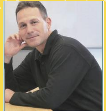
פרופ' חן שכטר