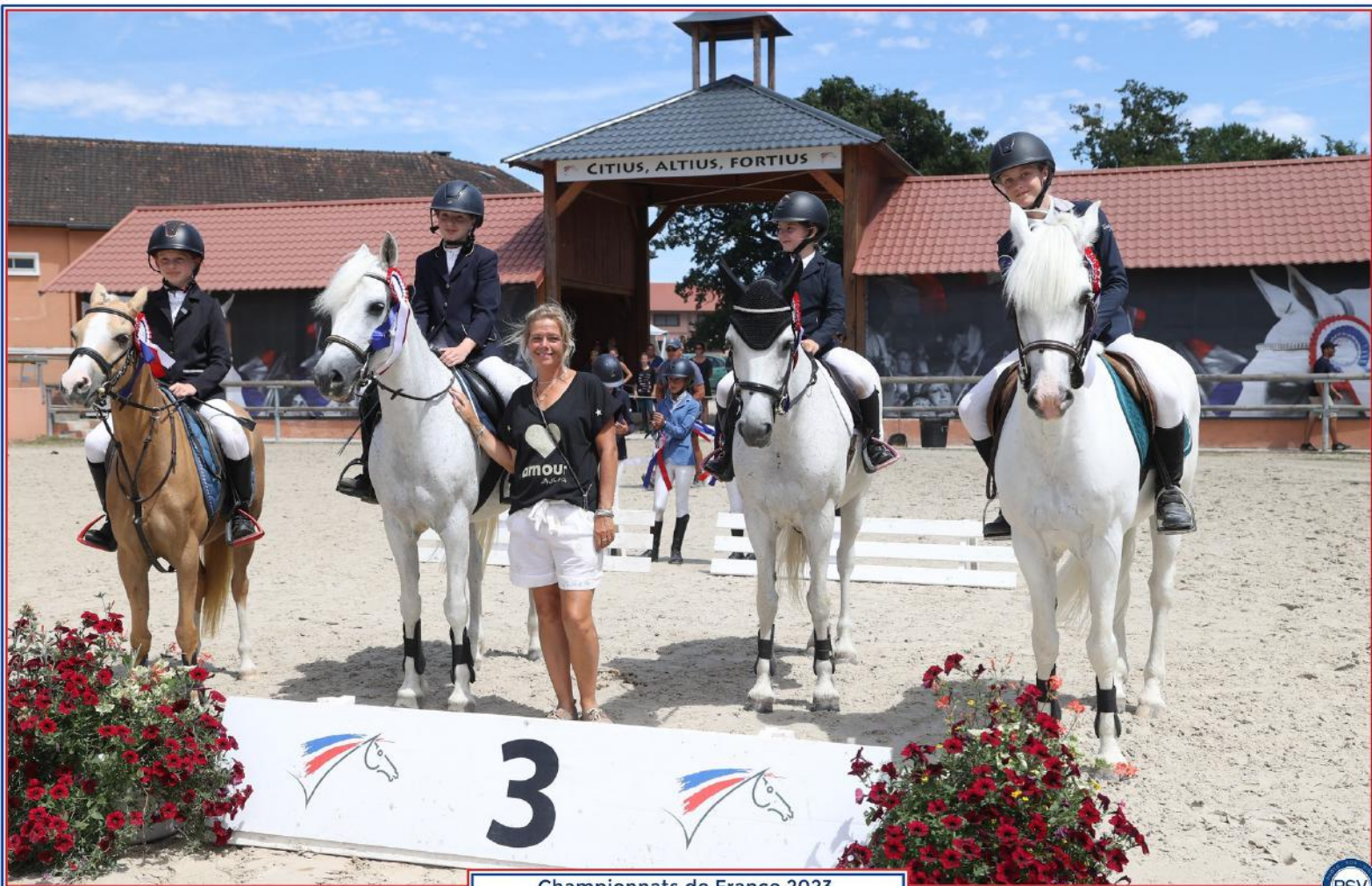
Championnats de France 2023 Generali Open de France