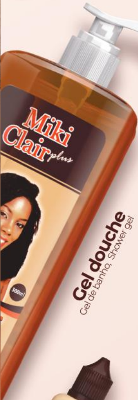
Gel douche Gel de bain, Shower Gel