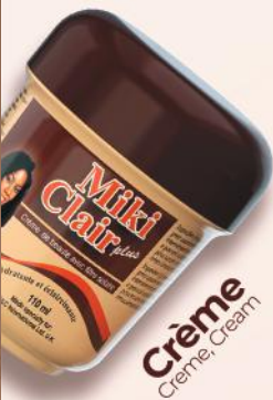
Crème Crème, Cream

MIKI CLAIR has been developed to deeply treat and lighten your skin. Its formula rich in glycerin, natural lanolin oils combined with vitamin C allows you to obtain a uniformly clear complexion and stimulate the tissue renewal system. Its application twice a day all over the body after bathing will leave your skin superbly graceful, smooth, young, clear and pleasantly scented.