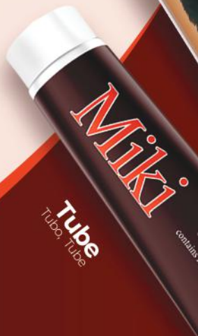
Tube Tubo, Tube