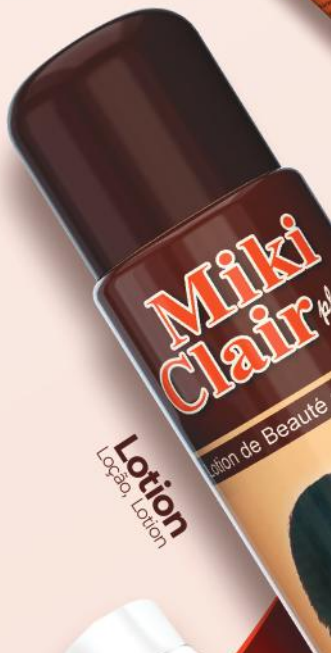
Lotion Loção, Lotion