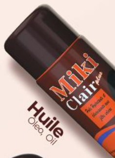
Huile Óleo, Oil