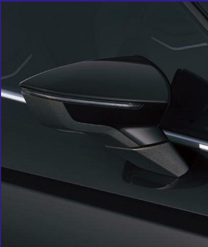
MIDNIGHT BLACK metallic Fr. 650.-