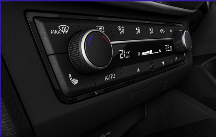
Winterpaket inkl. Sitzheizung und beheizbaren Aussenspiegeln