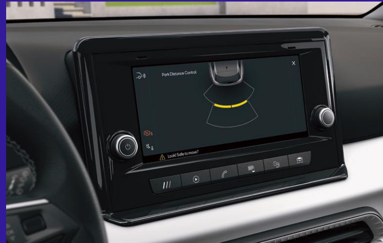
Einparkhilfe vorne und hinten mit optischer Anzeige