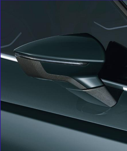
FIORD BLUE ohne Aufpreis