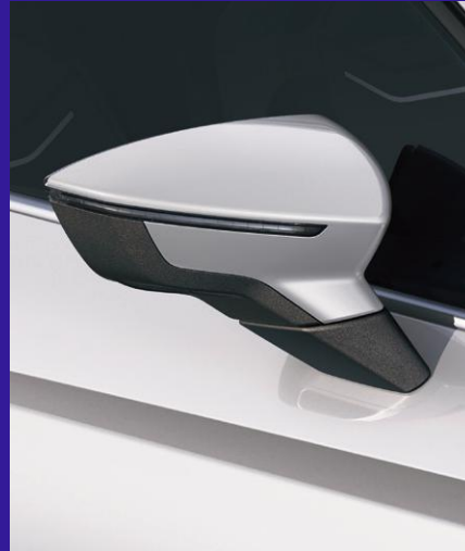
WHITE Fr. 250.-