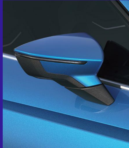
SAPPHIRE BLUE metallic Fr. 650.-