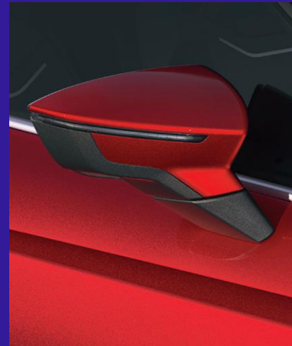
DESIRE RED metallic Fr. 800.-