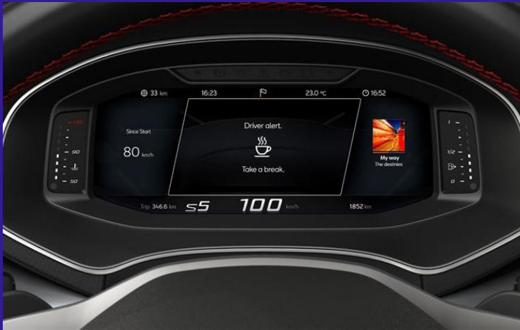
8" Digital Cockpit