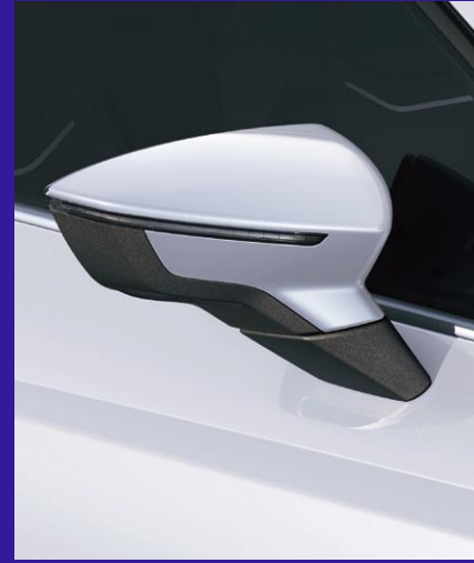
GLACIAL WHITE metallic Fr. 650.-