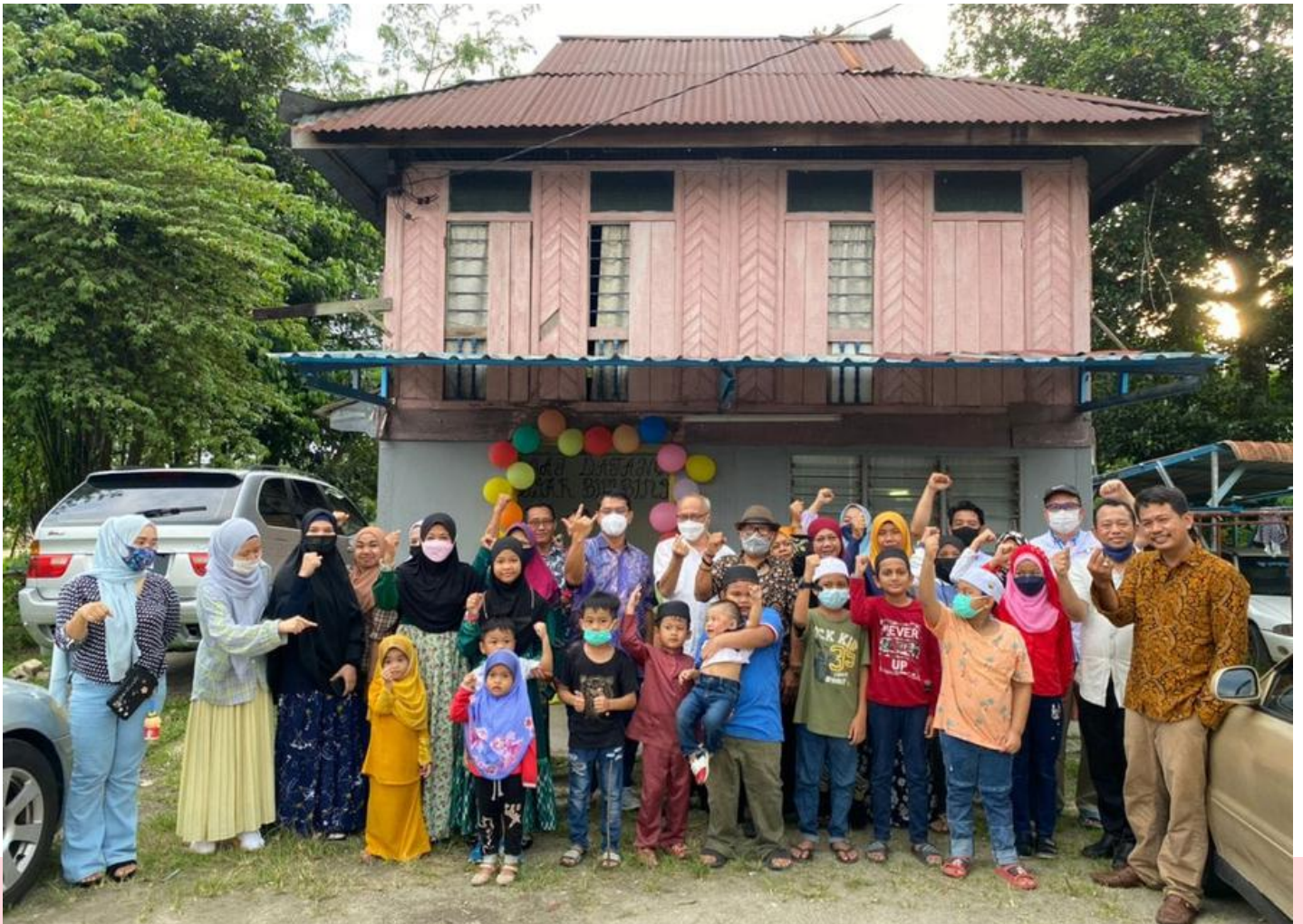
Photo : Diambil dari Facebook Atdikbud KBRI Kuala Lumpur (Komentar Muhammad Mukhotib)