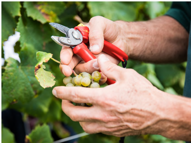
↑ Des raisins récoltés dans les jardins du quartier pour une cuvée 100 % rennaise !