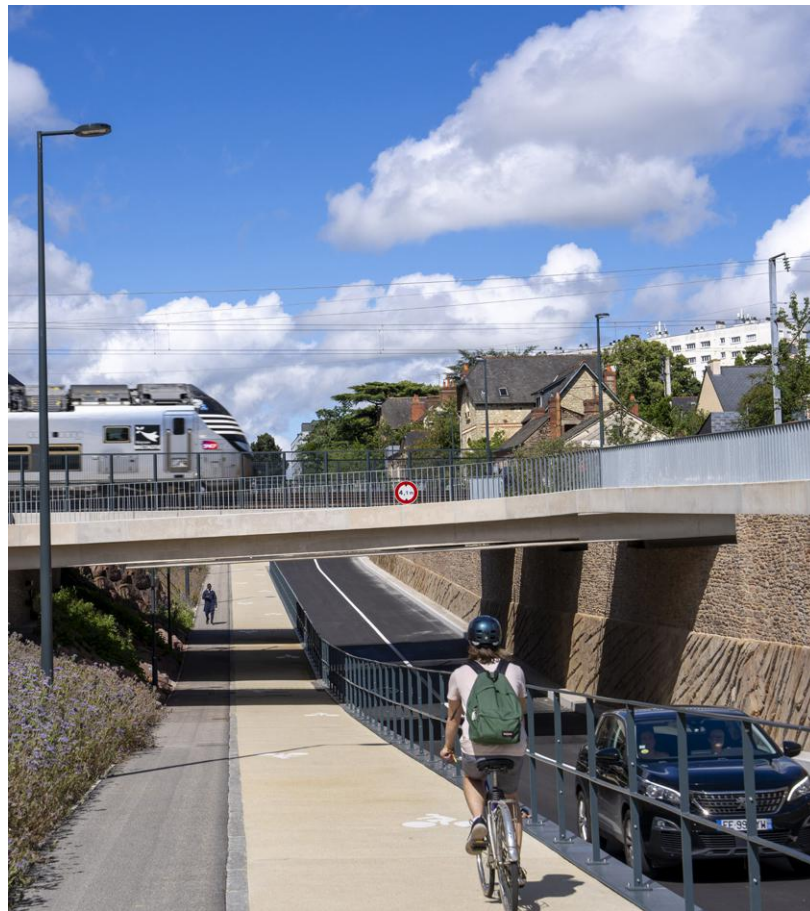
↑ Ce passage sous la voie ferrée est désormais sécurisé pour tous : automobilistes, piétons et cyclistes.

➤ Retrouvez toutes les initiatives de nettoyage citoyen à Rennes sur worldcleanupday.fr