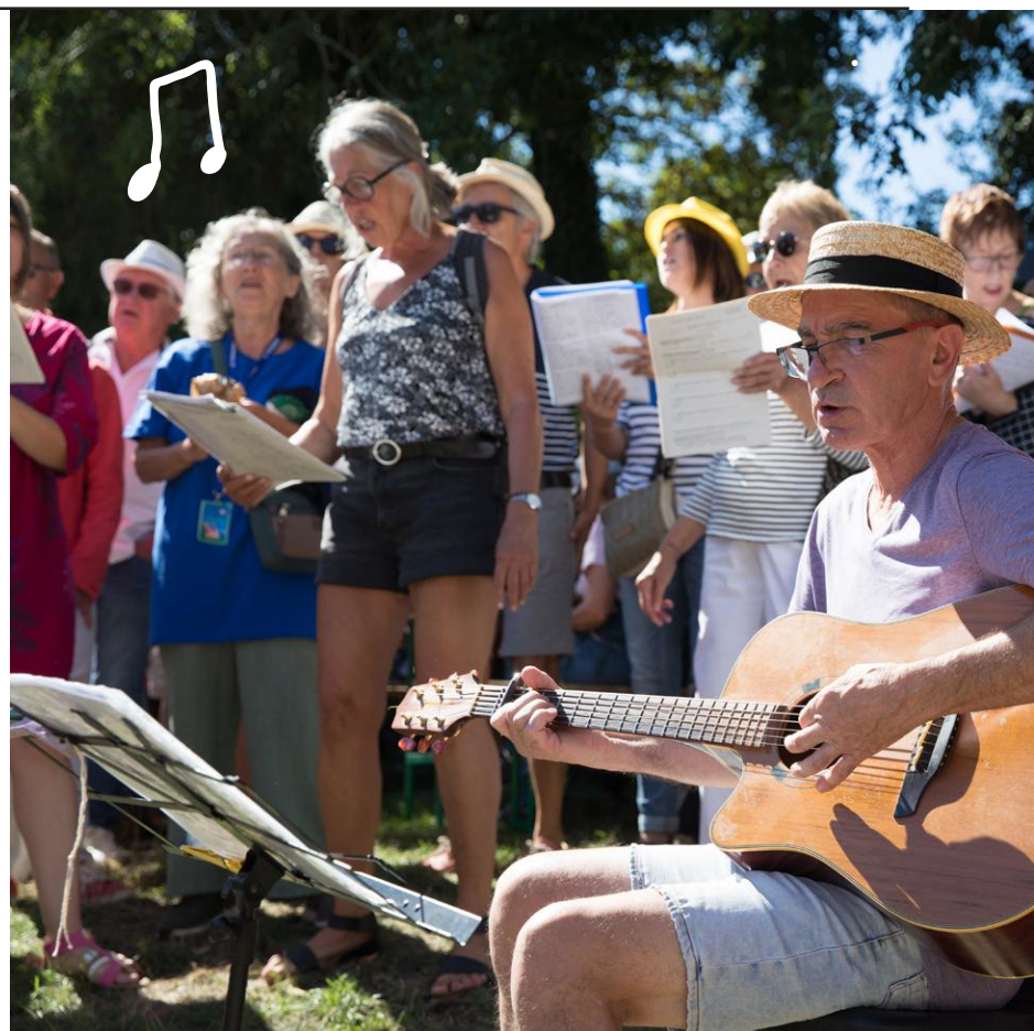
↑ La Ballade avec Brassens fête ses vingt ans, début septembre à Rennes. La promesse de beaux partages, comme ici en 2022 sur la promenade Georges-Brassens.

Tous les deux ans, les mordus de Georges Brassens affluent à Rennes pour écouter et jouer l'héritage du poète moustachu. Vingt ans que cela dure ! Populaire, la Ballade avec Brassens se joue des âges et des genres musicaux.