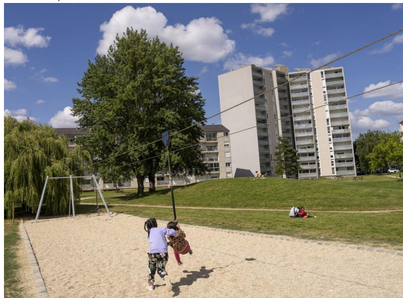
↑ Ça glisse, square des Hautes-Chalais.