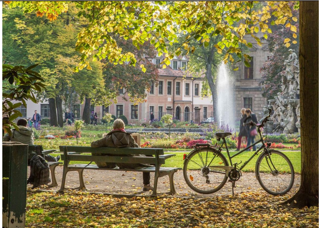
↑ Petite pause dans le parc d'Erlangen, ville bavaroise jumelée avec Rennes depuis soixante ans.

Les primaires bénéficient encore de deux salles de restauration avec isolation phonique. Une salle polyvalente et un plateau sportif extérieur font partie des espaces partagés ; ils pourront être utilisés par les associations du quartier, en dehors du temps scolaire.