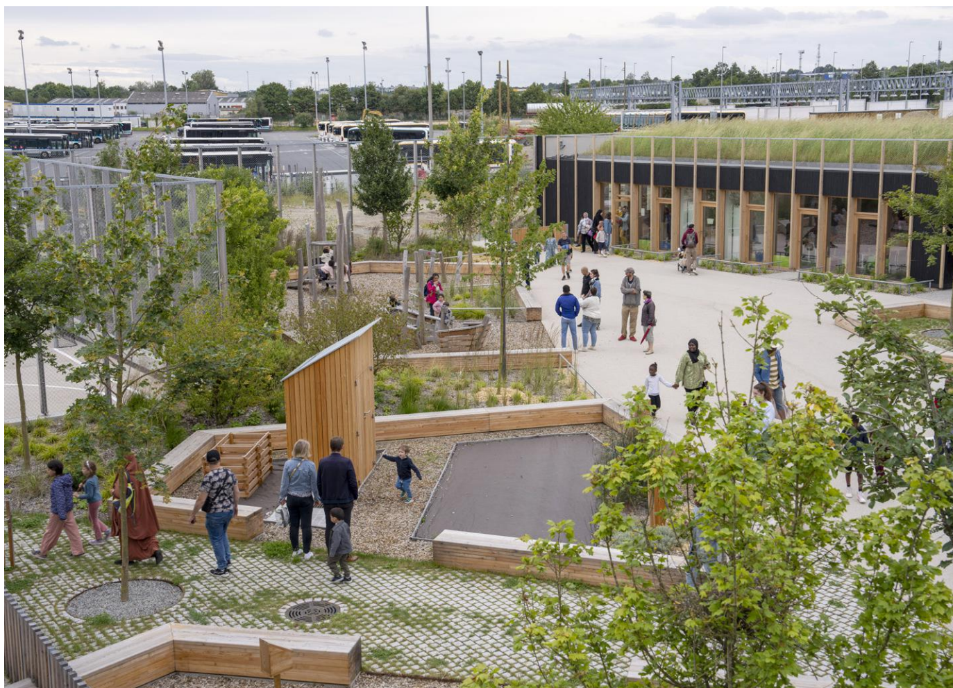
↑ La cour des maternelles abrite différentes essences d'érables, des jeux et du mobilier en bois.