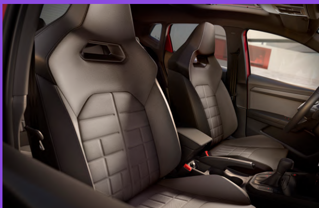
Sièges baquets sport et sièges chauffants