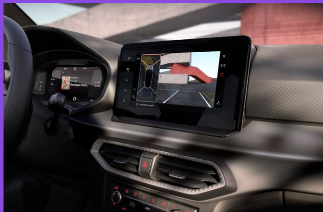
Aide au stationnement avant et arrière avec caméra de recul