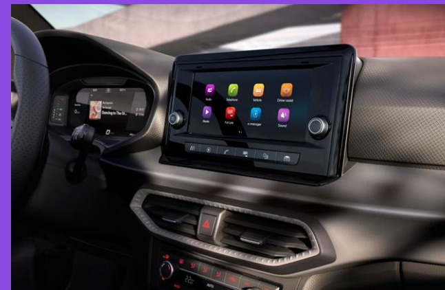
SEAT FULL LINK avec Apple Car Play & Android Auto