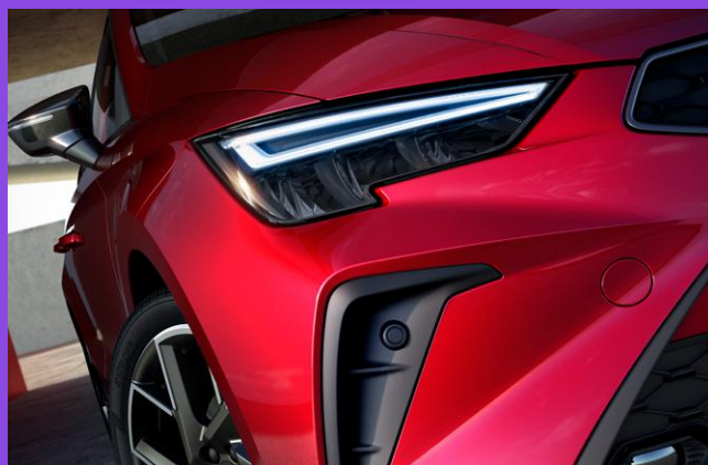
Full projecteurs LED avec réglage dynamique de la portée des phares.