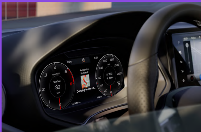
10.25" Digital Cockpit