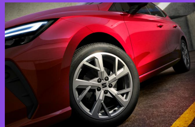
Jantes 17" DYNAMIC en Brilliant Silver