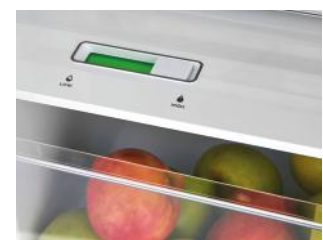
Regler zur Feuchtigkeitskontrolle