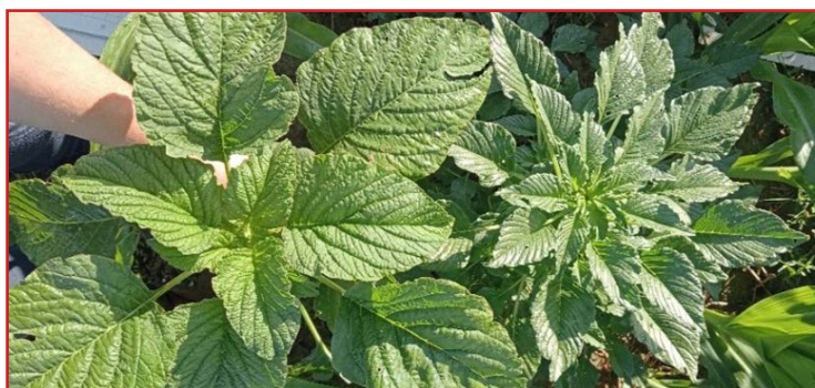
Planta de Amaranthus retroflexus (izda.) y de A. palmeri (dcha.).

Lo encontramos principalmente en parcelas de maíz o girasol, pero también se ha detectado en varias plantaciones de frutales , alfalfa , festuca y en barbechos de cereal. Se suele confundir con otras especies de bleo que tenemos en el territorio por lo que, si se tiene dudas, llamen al Centro de Sanidad y Certificación Vegetal para que les asesoren.