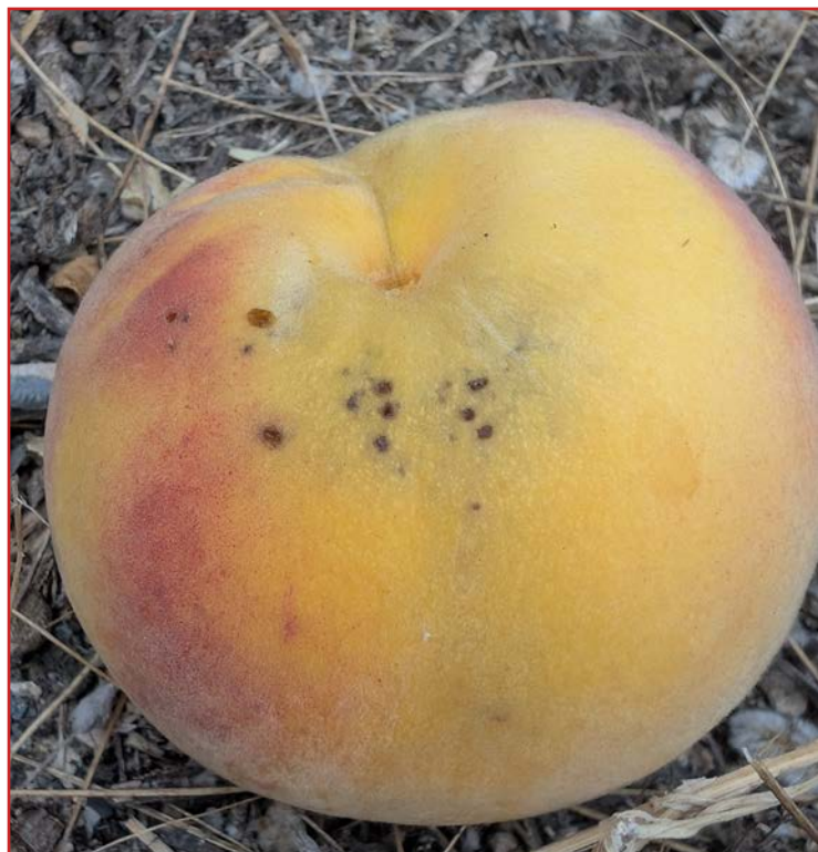
Daños de mosca de la fruta en melocotón

Al contrario de lo acaecido en las dos últimas campañas, hasta el momento no se han registrado las primeras capturas de la mosca de la