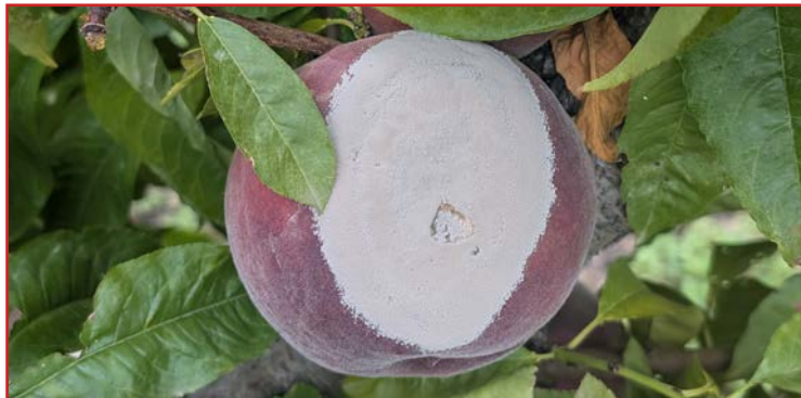
Síntomas de monilia en melocotón

Es importante tener en cuenta las infecciones latentes en esta enfermedad, ya que estas únicamente se manifiestan en el periodo de almacenamiento y distribución de la fruta. Para evitarlas, en los frutales de hueso pueden realizarse tratamientos postcosecha con productos a base de fludioxonil y pirimetanil.