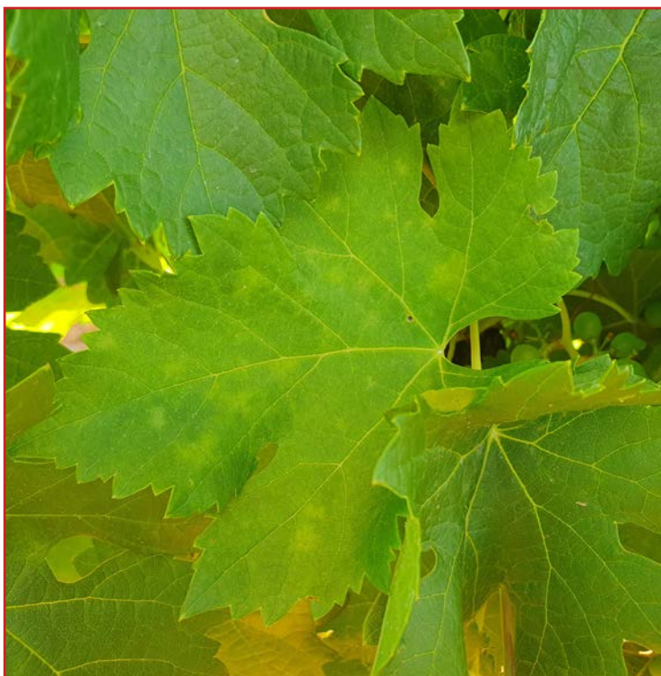
Primeros síntomas de oídio en hoja

El oídio es endémico en Aragón, y aunque de momento en esta campaña sólo se están viendo síntomas en parcelas tradicionalmente problemáticas, conviene tener protegido el cultivo en el periodo crítico (entre inicio de floración y cerramiento del racimo). La estrategia de lucha se basa en tratamientos preventivos. Se recomienda realizar en todas las viñas un tratamiento preventivo al inicio de floración, y otro entre cuajado y grano guisante. Los productos para los tratamientos se pueden consultar en el Boletín N° 2 .