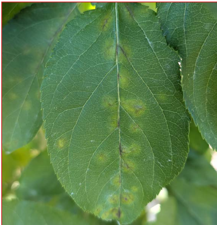
Daños de moteado en hoja de manzano

Pese a que hasta el momento la incidencia de esta enfermedad no está siendo elevada, en algunas parcelas de manzano y peral han comenzado a observarse síntomas de estos hongos. Si se produjeran precipitaciones abundantes o intensos rocíos, estas parcelas en las que se han localizado daños podrían presentar infecciones secundarias, por lo que se recomienda protegerlas, siempre que exista riesgo de contaminación, con alguno de los productos indicados en el Boletín Nº 2 .