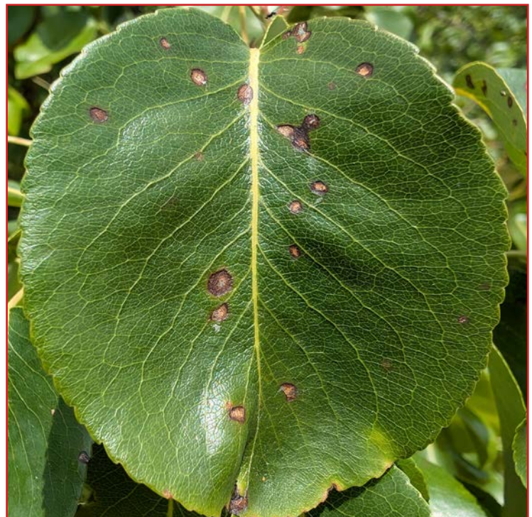
Síntomas de septoria en hoja de peral

Los primeros síntomas de esta enfermedad empezaron a apreciarse en las hojas de los perales a principios de mayo, incrementándose a causa de los chubascos que se produjeron a lo largo de dicho mes. No obstante, el daño únicamente ha sido visible en hoja, no registrándose en fruto hasta el momento. Tanto las parcelas que han presentado síntomas recientes, como aquellas que los sufrieron durante la campaña pasada y las de variedad Blanquilla, deben continuar vigilándose. En caso de tener que proteger el cultivo, es conveniente emplear alguno de los productos indicados en el Boletín Nº 2 . Siempre que sea posible, se recomienda usar materias activas con distinto modo de acción, así como productos de contacto.