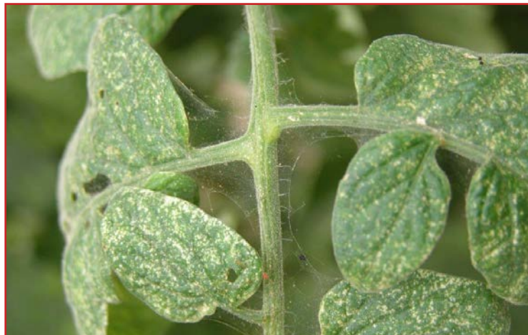
Ácaros del tomate

En cuanto se detecten los primeros síntomas, se deberán realizar tratamientos con los productos recomendados en el Boletín Nº 3 .