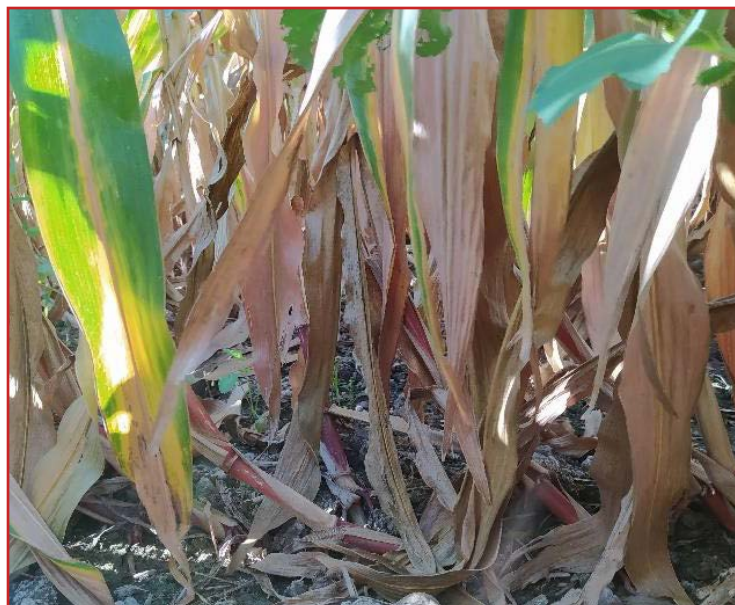
Daños en plantas de maíz ocasionados por diabrotica

Los daños más significativos los producen las larvas, que se alimentan de las raíces más finas en los primeros estados del cultivo y finalmente las raíces principales que son las que sustentan al cultivo. Esto provoca el tumbado de la planta, generando la deformación conocida como "cuello de ganso", característica de esta plaga.