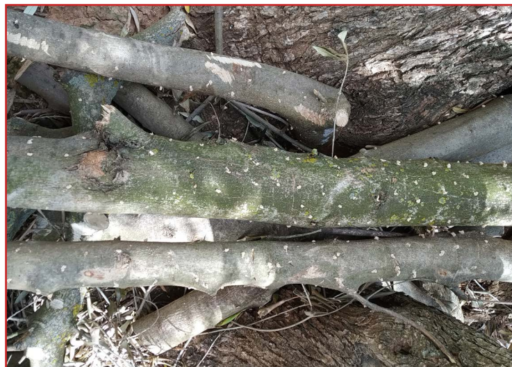
Troncos cebo para barrenillo

Los adultos ya han finalizado la entrada en las ramas cebo. En aquellas parcelas donde no se haya realizado la quema, se pueden triturar estos restos de poda durante el mes de junio.