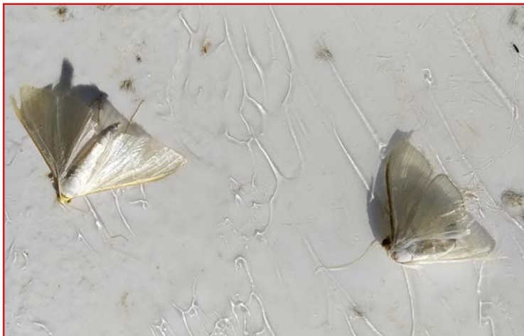
Adultos de glifodes en trampa

Desde inicios de primavera se suceden las generaciones de este lepidóptero que ataca a los brotes terminales. En plantaciones jóvenes en formación es necesario controlar los daños y en caso de ver presencia de larvas realizar tratamientos con algún producto de los relacionados en el Boletín N° 2 .