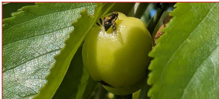
Adulto de mosca de la cereza en fruto

Los primeros adultos de mosca de la cereza fueron capturados durante la última semana del mes de abril en las zonas frutícolas más tempranas de nuestra comunidad. Si se dan las condiciones climáticas adecuadas para su desarrollo (baja humedad relativa acompañada de altas temperaturas), este díptero puede producir daños en las cerezas desde el cambio de color hasta su recolección, por lo que durante este periodo es necesario vigilar las plantaciones y si fuera necesario, llevar a cabo tratamientos fitosanitarios con alguna de las materias activas indicadas en el Boletín Nº 3 .