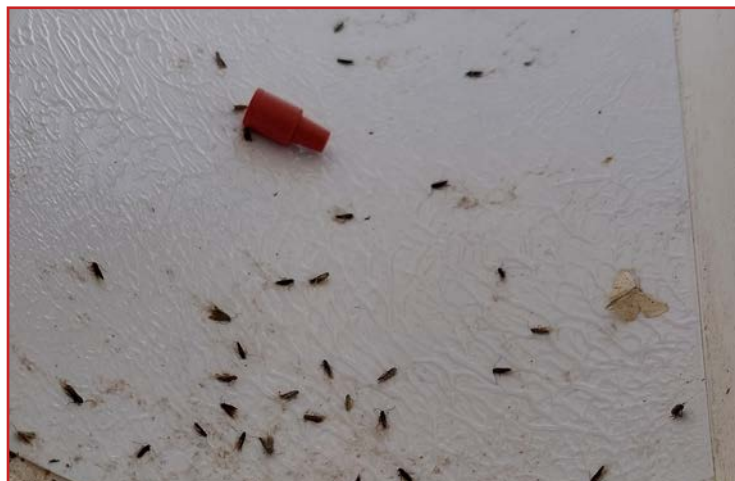
Capturas de tuta

El calor puede provocar aumentos importantes de tuta, la incidencia de esta plaga está muy influenciada por las temperaturas, por lo que el aumento de las mismas, típico de esta época del año, provoca los primeros vuelos de la polilla. Se recomienda la colocación de trampas para la detección de los primeros vuelos. Según el volumen de capturas, se valorará la conveniencia de aplicar tratamientos fitosanitarios, siempre siguiendo las recomendaciones publicadas en el Boletín Nº 3 para prevenir las resistencias de la plaga.