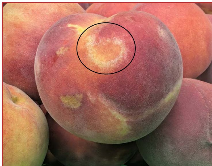
Daño de trips en melocotón

suelo puede tener cierta influencia en el control de esta plaga evitando que estos insectos colonicen los frutales.