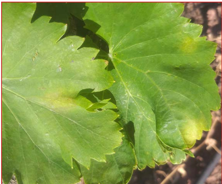
Manchas de aceite (ATRIA Sta. Ana – Niño Perdido)

Las condiciones de esta primavera han sido adecuadas para el desarrollo del hongo. Prácticamente en todas las zonas vitícolas se han encontrado síntomas (aislados de momento) de la enfermedad: sobre todo manchas de aceite, puntualmente fructificadas. Las altas temperaturas de finales de mayo no favorecen el desarrollo de la enfermedad. No obstante, como el periodo de mayor sensibilidad al mildiu es el que abarca de la floración al cuajado, se recomienda no labrar en el período entre floración y cuajado para no facilitar la dispersión del reservorio de hongo en el suelo. En las zonas más tardías, realizar un tratamiento preventivo en prefloración o al inicio de ésta con un producto sistémico. Las principales características de los distintos grupos de productos contra el mildiu, así como los productos autorizados, figuran en el Boletín N° 3 .