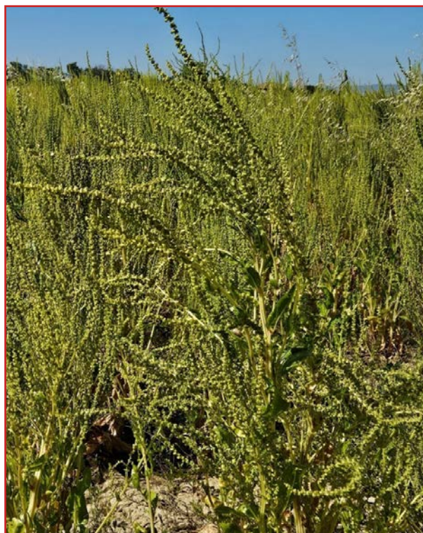
Individuo de Rumex crispus (izda.) y de Beta vulgaris (dcha.), en esta imagen vemos la cultivada para semilla, muy similar a la silvestre

EN CASO DE ENCONTRAR O TENER LA SOSPECHA DE LA PRESENCIA DE A. palmeri AVISAR AL CSCV.