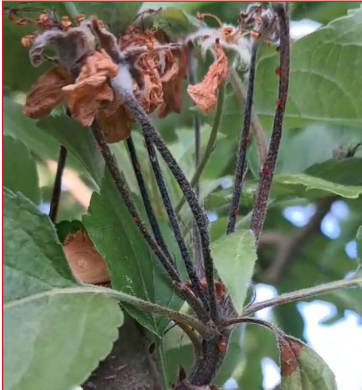
Síntomas de fuego bacteriano en manzano

Desde hace unas semanas es posible observar los síntomas que produce la bacteria Erwinia amylovora (Fuego bacteriano) tanto en parcelas de peral como de manzano. A causa de la falta de productos curativos para su control, es necesario eliminar las partes afectadas para disminuir la cantidad de inóculo de la bacteria en los cultivos, cortando al menos 40 cm por debajo de cualquier síntoma visible y destruir inmediatamente después las partes afectadas. Además de lo anterior, con el objetivo de evitar la propagación de la enfermedad, es necesario proteger los cortes realizados y desinfectar las herramientas empleadas para ello, así como seguir vigilando las parcelas, en especial si se producen tormentas de pedrisco o floraciones secundarias.