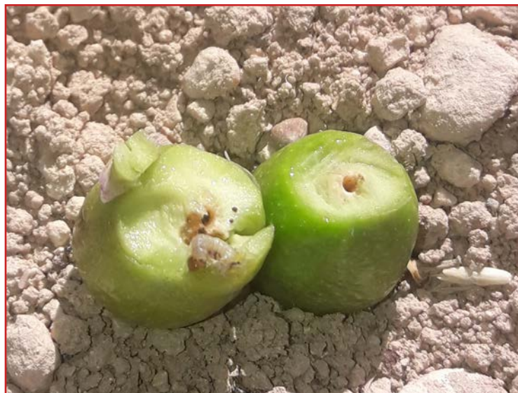
Olivas caídas afectadas por prays

Los productos autorizados aparecen en el Boletín N° 2 . En el caso de usar caolín, hay que tener en cuenta que recubre los frutos evitando la ovoposición; por tanto, el tratamiento debe aplicarse antes de que el prays inicie la puesta.