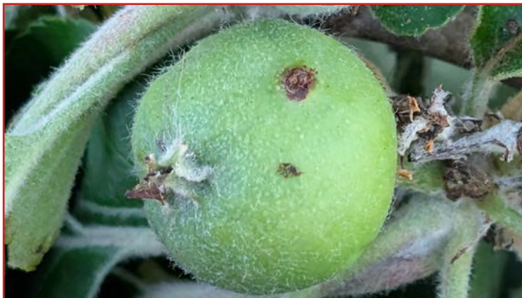
Daños de carpocapsa en manzana

Las primeras capturas de este lepidóptero se produjeron en la comarca del Bajo Cinca durante la primera semana del mes de abril. Sin embargo, estas no se generalizaron hasta finales de dicho mes, localizándose los primeros daños a mediados de mayo en plantaciones de manzano. Durante el mes de junio la emergencia de larvas continuará y, como consecuencia, un previsible aumento de los daños. Por tanto, aquellas parcelas con porcentajes de pérdidas elevadas en campañas anteriores deben ser controladas de manera especial con el objetivo de encontrar penetraciones recientes que indiquen el momento adecuado para llevar a cabo los tratamientos. Los productos autorizados con los que realizar las aplicaciones fitosanitarias vienen indicadas en el Boletín N° 3 . En caso de que se produzcan precipitaciones, dichos tratamientos deberían repetirse o aumentar su frecuencia.