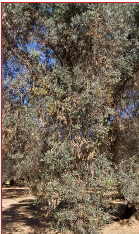
Olivo afectado por barrenillo negro

Los productos autorizados para barrenillo aparecen en el Boletín Nº 2 .