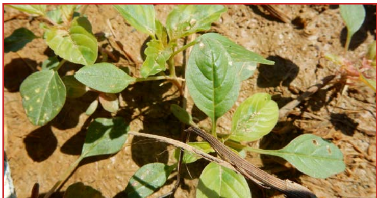
Plántula de palmeri donde se aprecian los peciolos alargados

La principal diferencia entre palmeri y otros bledos en esta época del año es la longitud del peciolo de la hoja , mucho mayor que el haz de la hoja en palmeri. Esta diferencia se verá con mayor claridad en las hojas más viejas, es decir, las que están más cerca del suelo. Además, la ausencia de pelo ayuda a diferenciarla de otras especies de bledo.