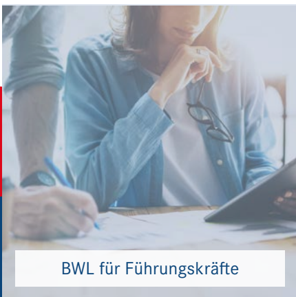
BWL für Führungskräfte