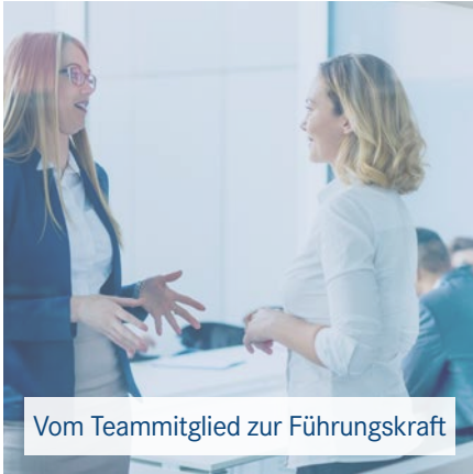
Vom Teammitglied zur Führungskraft