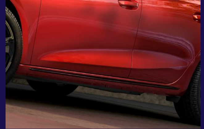
Seitenschweller in Black