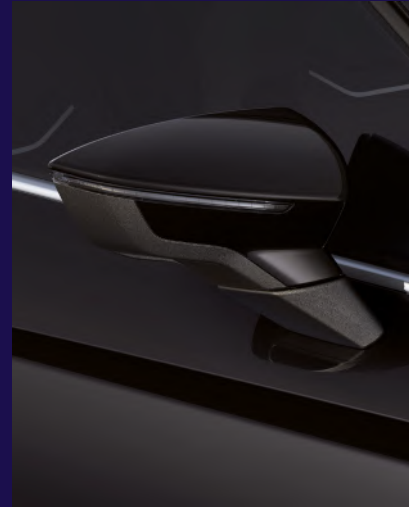
MIDNIGHT BLACK metallic Fr. 800.-