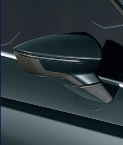
FIORD BLUE ohne Aufpreis