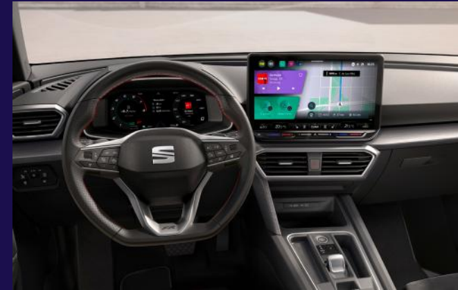
Interieur mit Dinamica Sitzen und 10.4" Display inkl. SEAT FullLink