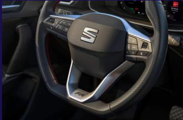
Ledermultifunktionslenkrad mit Schaltwippen