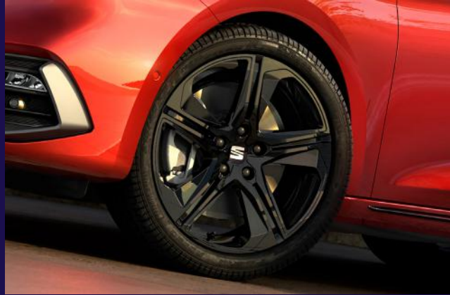
18-Zoll Alufelgen in Black