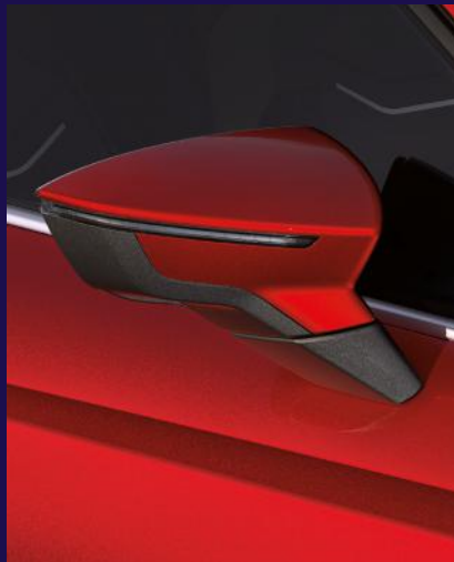
DESIRE RED metallic Fr. 1'200.-