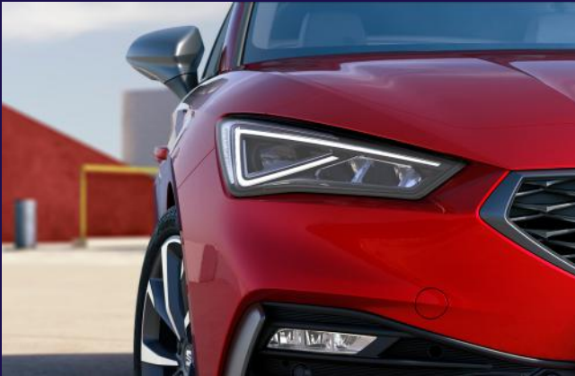
LED Tagfahrlicht und Matrix-LED Scheinwerfer