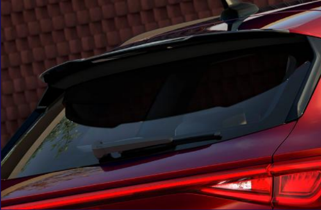
Dachspoiler in Black und durchgehende LED Heckleuchten