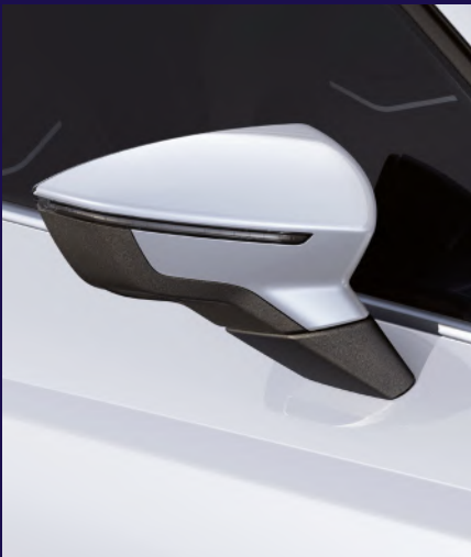
GLACIAL WHITE metallic Fr. 800.-