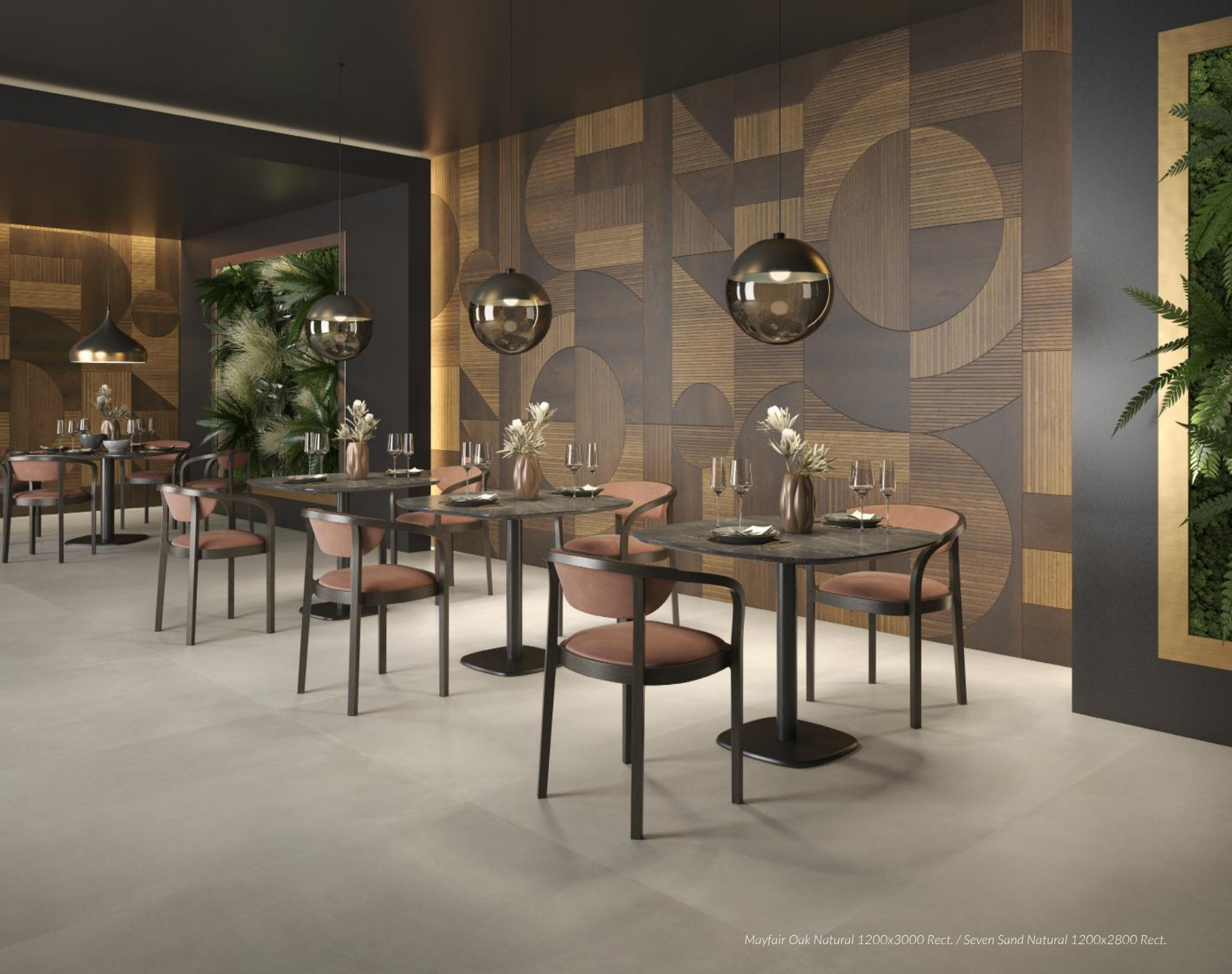
Mayfair Oak Natural 1200x3000 Rect. / Seven Sand Natural 1200x2800 Rect.