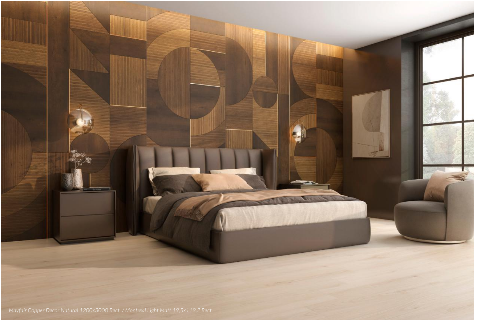
Mayfair Copper Decor Natural 1200x3000 Rect. / Montreal Light Matt 19,5x119,2 Rect.