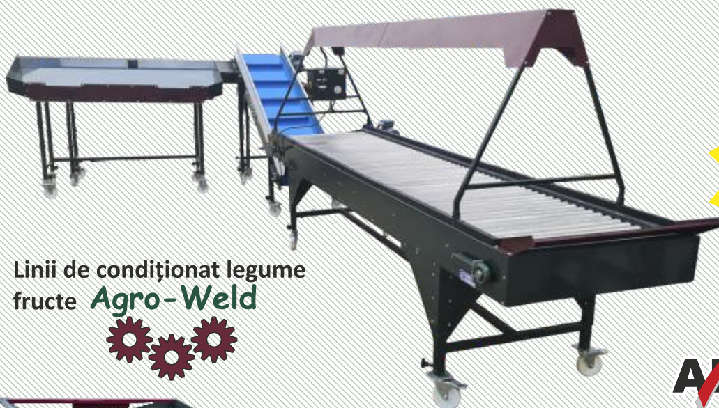
Linii de condiționat legume fructe Agro-Weld