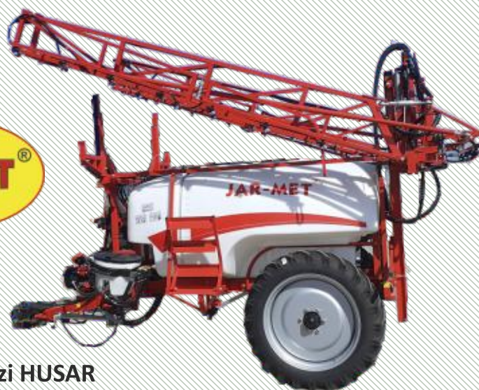
Pulverizatorul pentru livezi HUSAR Sprayer pomicol – de la pomicultor la pomicultor!