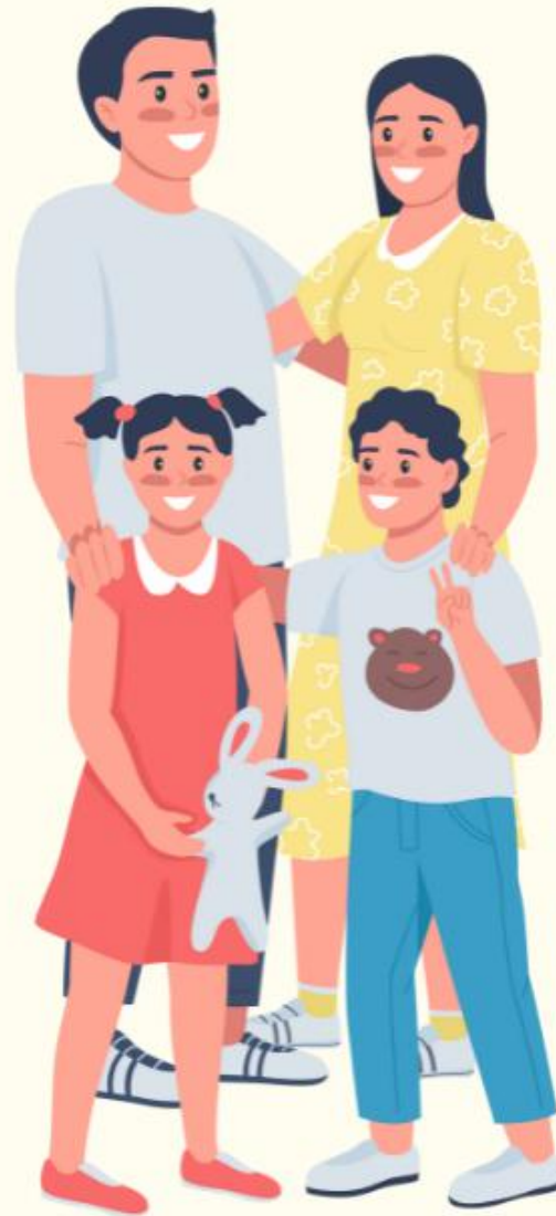
ผู้ปกครอง