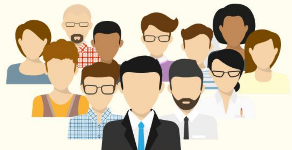
ประชาชนทั่วไป