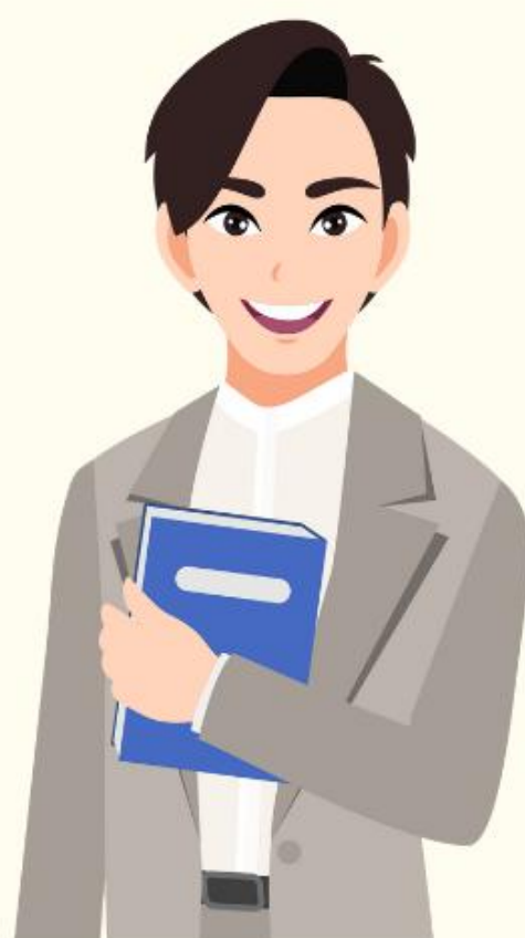
ผู้บริหาร สถานศึกษา