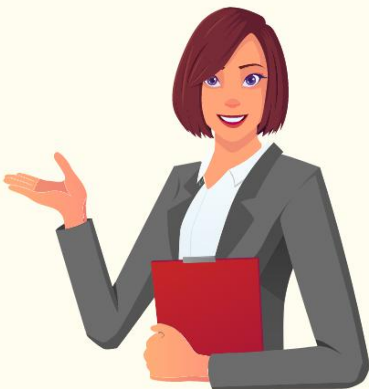
เจ้าหน้าที่ สถานศึกษา