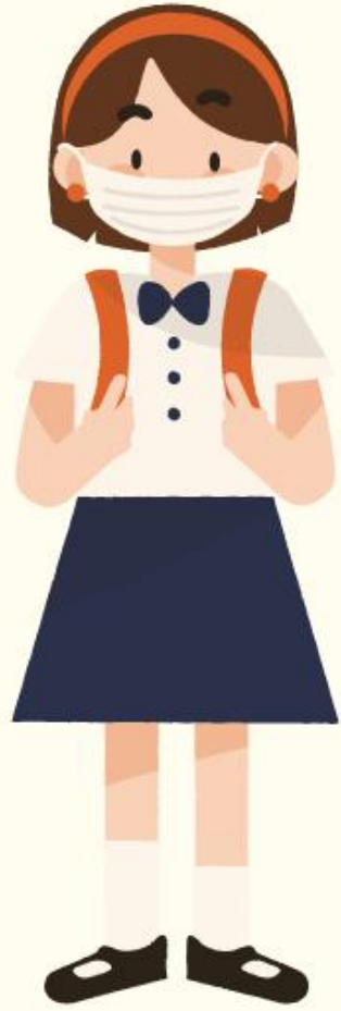
นักเรียน