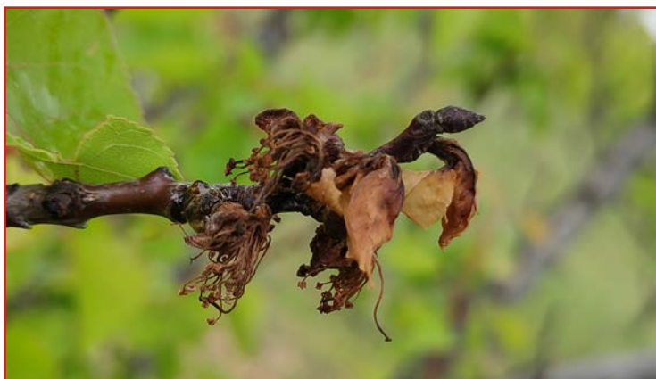
Daños de monilia en flores de albaricoquero

Aunque la monilia es una enfermedad que puede afectar al almendro y a todos los frutales de hueso, la especie más sensible es el albaricoquero. Los tratamientos fitosanitarios contra ella no siempre están justificados, ya que para llevarlos a cabo deben darse las condiciones adecuadas