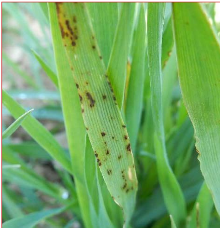
Síntomas de Helminthosporiosis sobre una hoja de cebada

En el caso de que sea necesaria una actuación con productos químicos se podrán utilizar los productos fitosanitarios autorizados en el Registro de Productos Fitosanitarios del Ministerio de Agricultura, Pesca y Alimentación.