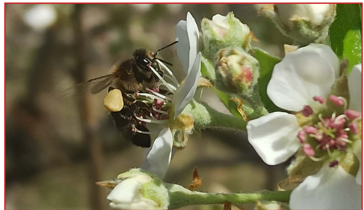
Abeja polinizando en flores de peral