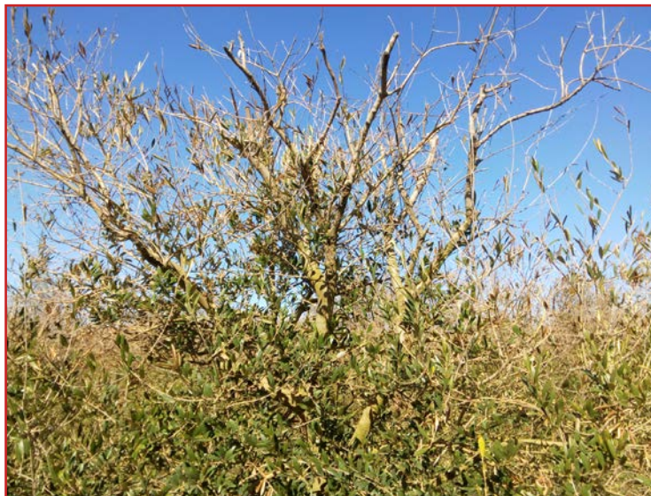
Daños por frío en olivo

Durante el mes de enero se han producido heladas por todo el territorio de Aragón, afectando en mayor o menor medida a los olivos, ocasionando daños por defoliación y necrosado de ramas finas. Pasado el invierno aquellas ramas afectadas por el frío se deben podar y después