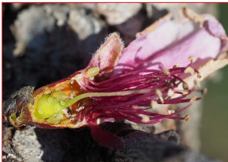
Pulgones dentro del cáliz de una flor