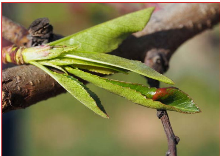
Síntomas iniciales de abolladura en melocotonero

Son recomendables las aplicaciones a base de productos cúpricos previas a la floración renovándolas cada 14 días, siendo siempre necesario ajustar los tratamientos a las fenologías de las distintas variedades. También deben respetarse las condiciones indicadas en la etiqueta, entre las que se encuentran el número de aplicaciones autorizado, la época de aplicación y la cantidad de cobre establecida por hectárea. Estos tratamientos pueden tener algún efecto en el control de otras enfermedades bacterianas como Xantomonas arboricola .