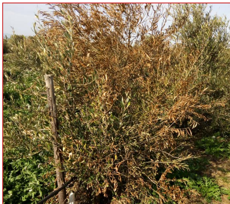
Fuerte ataque de Verticillium en olivo joven (decaimiento rápido)

A finales de invierno o inicio de la primavera, este hongo que se encuentra en el suelo, se desarrolla produciendo el secado de brotes y ramas secundarias. Los síntomas en esta época se conocen como apoplejía o decaimiento rápido, y en el caso de olivos jóvenes pueden llegar a producir su muerte. Más adelante, en primavera o verano, también puede manifestarse (decaimiento lento) secando las inflorescencias o incluso los frutos. En ambos casos, las hojas secas caídas vuelven a infectar el suelo generando nuevos ciclos de la enfermedad.