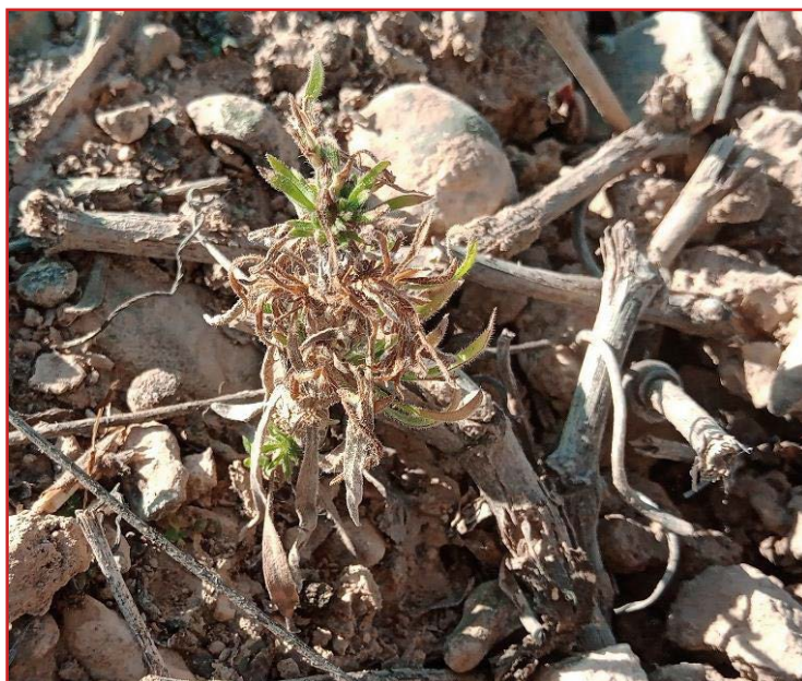
Plántulas de coniza al lado de un tubo de gotero como referencia de tamaño y planta de coniza segada y rebrotando

En todo momento, puede consultar el Boletín y las Informaciones Fitosanitarias , y en la página web del Gobierno de Aragón: aragon.es - sanidad y certificación vegetal.