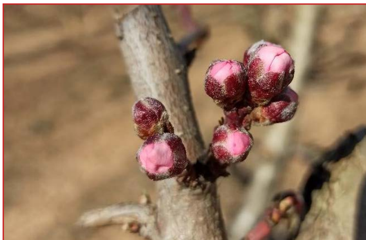
Estado fenológico "D" en melocotonero