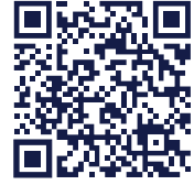
LISTA DE EMBARCAÇÕES AUTORIZADAS E MAIS INFORMAÇÕES