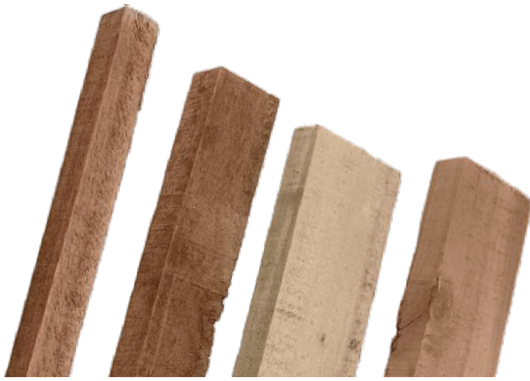
ไม้กระถิน ส