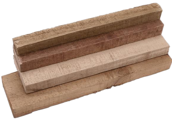
ไม้กระถิน อ