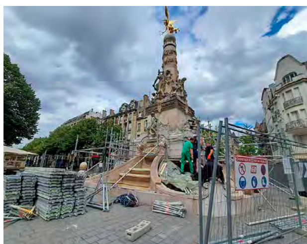
Cette campagne de restauration doit durer jusqu'au 19 juin.

Après la dépose des plantations, la coupure de l'eau et la vidange des bassins, la fontaine Subé est désormais entourée de barrières de sécurité depuis le mercredi 13 mai. Un échafaudage est en cours