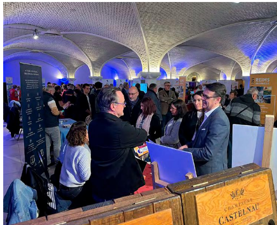
La Journée des réseaux de la CCI vise à favoriser les échanges et créer des liens entre les acteurs économiques du territoire.

La CCI Marne Ardennes organise, le mardi 9 juin au caveau De Castelneau à Reims, la 5e Journée des réseaux, un rendez-vous dédié aux échanges qui s'adresse à tous les acteurs économiques du territoire.