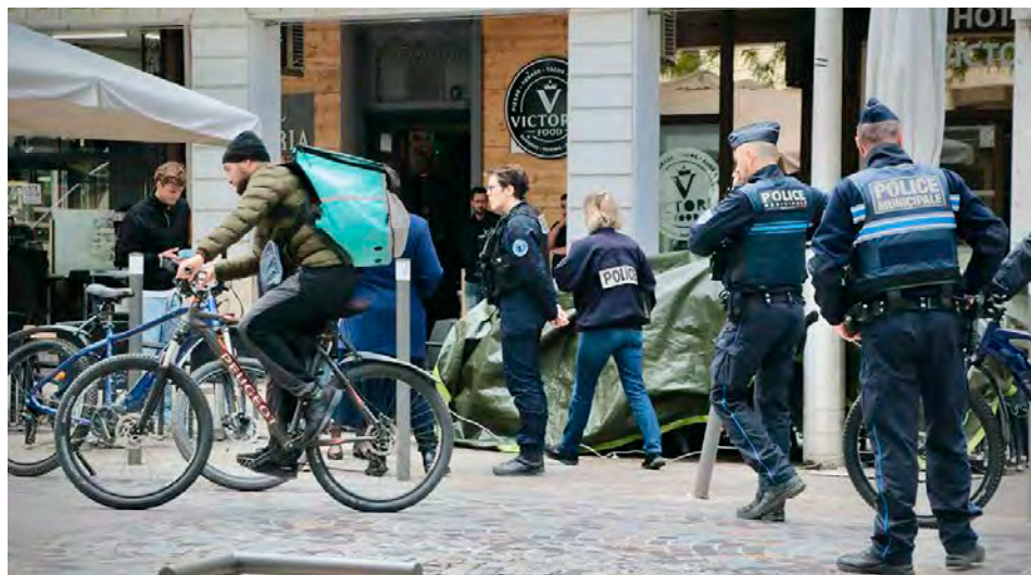
Polices municipale et nationale ont mené de nombreux contrôles, mardi matin, en centre-ville de Reims.

Il y avait du bleu, mardi matin, sur la place d'Erlon, à Reims. Les polices nationale et municipale ont mené une importante opération portant sur « les contrôles des engins de mobilité et la sécurisation de l'espace », à laquelle la presse était conviée. Coup de comm' ou coup de force ? « Chaque semaine, des contrôles sont réalisés et nous constatons que beaucoup trop de personnes ne connaissent pas la réglementation, a souligné le sous-préfet de Reims, Fayçal Douhane. Cette opération massive sert à sensibiliser la population et à rappeler la réglementation. La place d'Erlon est un espace piéton, qui doit le rester. » Le sous-préfet a notamment rappelé que la circulation à vélo doit s'y faire au pas et qu'elle est interdite sur les trottoirs. Concernant les trottinettes électriques, il a précisé que leur vitesse maximale est limitée à 25 km/h et que circuler sur un trottoir ou une voie interdite expose le contrevenant à une amende de 135 €. Il a égale-