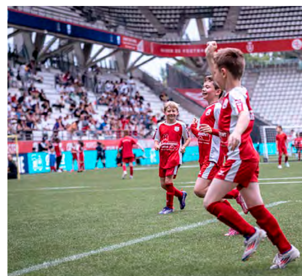
Environ 3 000 participants, des U7 aux seniors, sont attendus à Delaune.