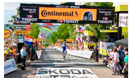
L'arrivée de Julian Alaphilippe en solitaire à Épernay le 8 juillet 2019.

Au moment d'annoncer la grande nouvelle, beaucoup de participants ont évoqué la fameuse 3e étape du Tour de France 2019. Après deux journées inaugurales en Belgique, la troisième proposait aux coureurs un parcours accidenté, entre Binche et Épernay. Comme prévu, le spectacle était au rendez-vous dans les derniers kilomètres, grâce aux côtes d'Hautvillers (900 m à 10,5 %), de Champillon (1,8 km à 6,6 %) et de Mutigny (900 m à 12,2 %). C'est sur les pentes de cette dernière difficulté que le Français Julian Alaphilippe décida d'attaquer et de lâcher le peloton, à 16 km de l'arrivée. Il dépassa Tim Wellens, se promena seul dans les rues d'Épernay, avant de franchir la ligne d'arrivée en solitaire, au sommet de la courte mais exigeante rue des Coteaux (500 m à 8 %). Avec 26 secondes d'avance sur son premier poursuivant, le coureur de la Deceuninck-Quick Step s'empara ce jour-là du maillot jaune, qu'il conserva pendant quatorze jours. Eu égard au succès sportif et populaire de cette étape du 8 juillet 2019, il y a fort à parier qu'un tracé similaire sera proposé aux coureurs en 2028.