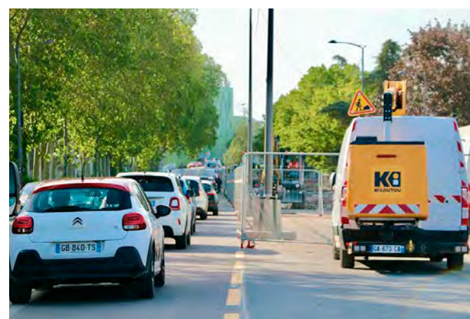
Sur une partie du boulevard Paul-Doumer, on ne circule plus que sur une voie.

Les automobilistes rémois ont dû s'en rendre compte cette semaine : ça bouchonne à nouveau sur le boulevard Paul-Doumer. Du côté du canal, la circulation se fait sur une seule voie, et non plus sur deux, et la bretelle passant sous le pont de Venise sera fermée durant les nuits des mardi 26, mercredi 27 et jeudi 28 mai. La fin de l'opération est prévue pour le jeudi 4 juin et le boulevard retrouvera alors quatre voies de circulation.