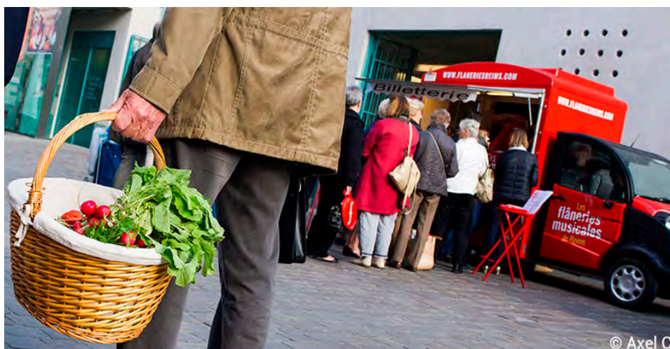
Le camion-billetterie s'installera, samedi matin, au marché du Boulingrin.

On ne sait pas encore si le concert d'ouverture des Flâneries musicales pourra se tenir au cœur de la basilique Saint-Remi, le monument étant partiellement fermé en raison d'une importante avarie de sa toiture. En revanche, le grand festival annuel de musique classique de Reims confirme que la représentation inaugurale de l'Orchestre philharmonique royal de Prague aura bien lieu le jeudi 18 juin, à 20 h, à la basilique ou ailleurs si les conditions l'exigent.