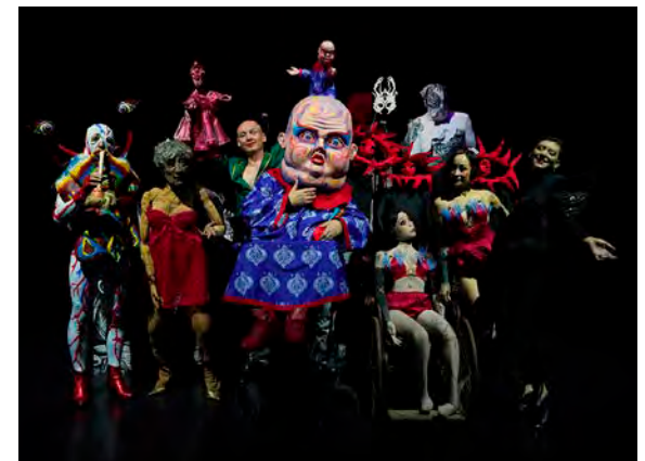
Les marionnettes de Succursale 101 ouvriront le bal, vendredi soir.

Pendant tout le week-end, le Cellier (payant), le musée-hôtel Le Vergeur, l'hôtel Saint-Jean-Baptiste-de-La-Salle et la scène du cryptoportique accueilleront une myriade de spectacles variés, sans oublier les déambulations sur la place du Forum, le parvis de la cathédrale, les promenades ou encore le marché du Boulingrin. Alors, ouvrez l'œil !