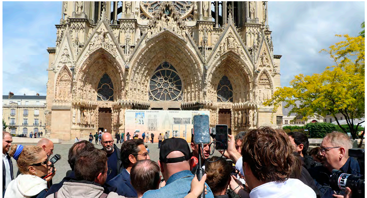
L'officialisation de Reims comme ville départ du Tour de France 2028 a attiré les médias, lundi 18 mai, au pied de la cathédrale.