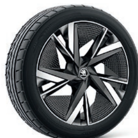
Cerchi in lega leggera 8,0J x 20" & 9,0J x 20" «Taurus», antracite