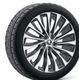
Cerchi in lega leggera 8,0J x 20" & 9,0J x 20" «Asterion», antracite