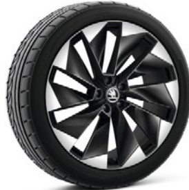
Cerchi in lega leggera 8,5J x 21" & 9,0J x 21" «Supernova Sportline», nero