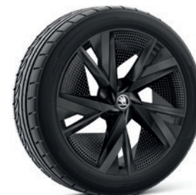
Cerchi in lega leggera 8,0J x 20" & 9,0J x 20" «Taurus», nero