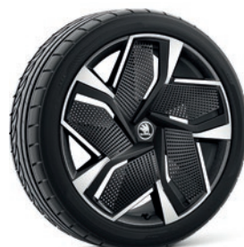
Cerchi in lega leggera 8,0J x 20" & 9,0J x 20" «Vision RS», antracite