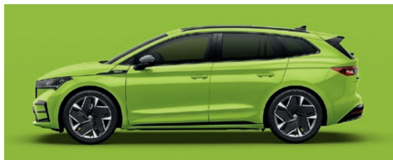
Unita Mamba Verde