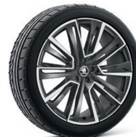
Cerchi in lega leggera 8,5J x 21" & 9,0J x 21" «Aquarius», antracite

I prezzi si intendono in franchi svizzeri incl. IVA dell'8.1%. Alcuni degli equipaggiamenti supplementari riportati in alto possono essere ordinati solo in abbinamento con altri equipaggiamento supplementari. Inoltre, non tutti gli equipaggiamenti supplementari elencati sono combinabili tra loro. Per informazioni particolareggiate la preghiamo di rivolgersi al suo partner Škoda.