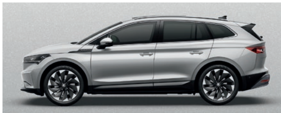
Metallizzato Argento Brilliant