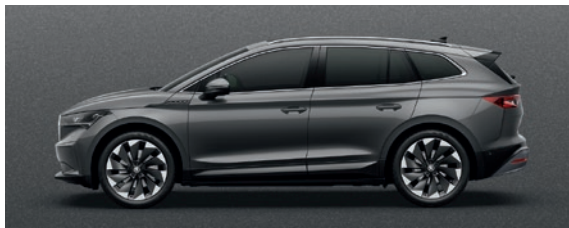
Metallizzato Grigio Graphite