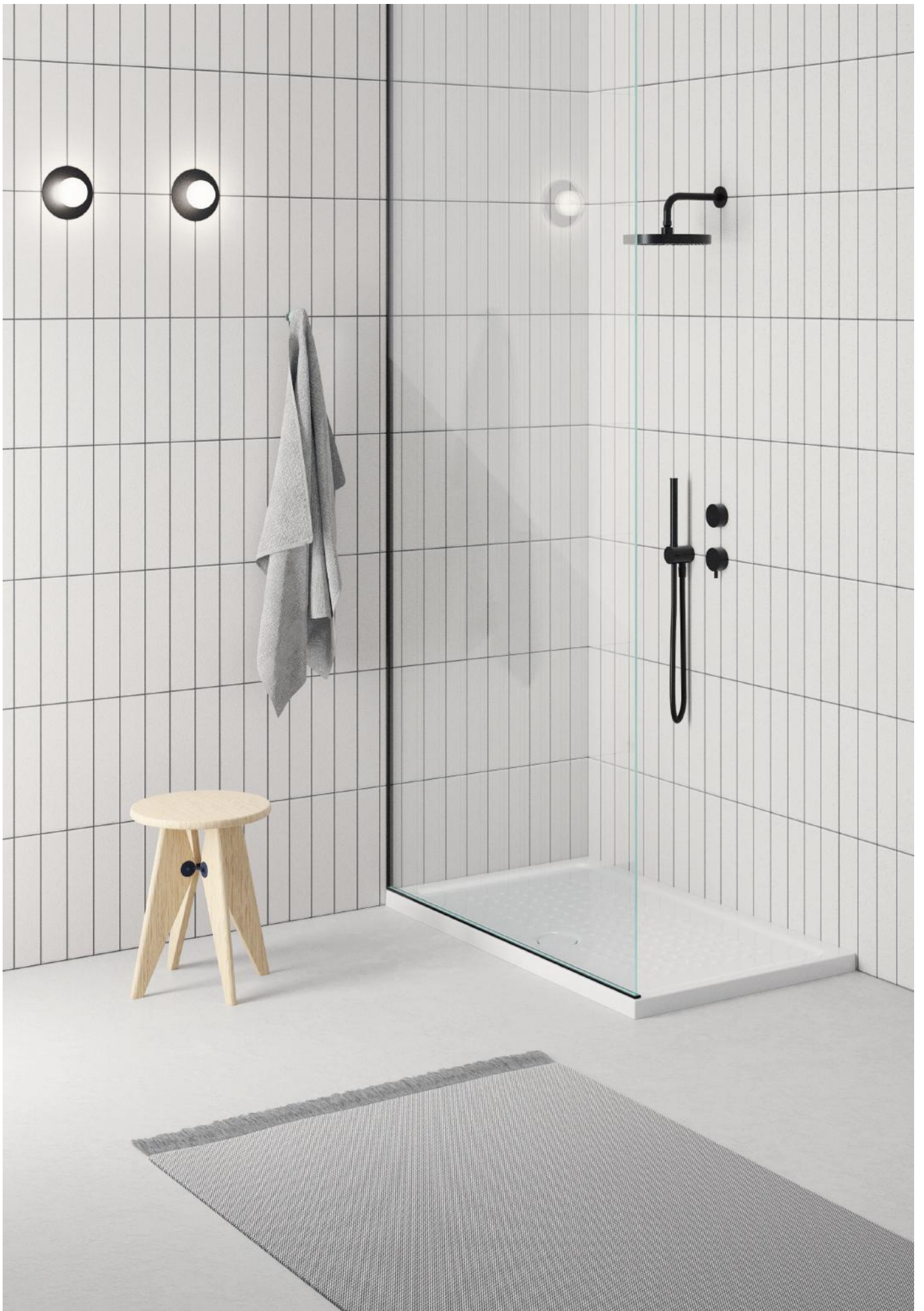
100x70 Piatto doccia / Shower tray / Duschwanne