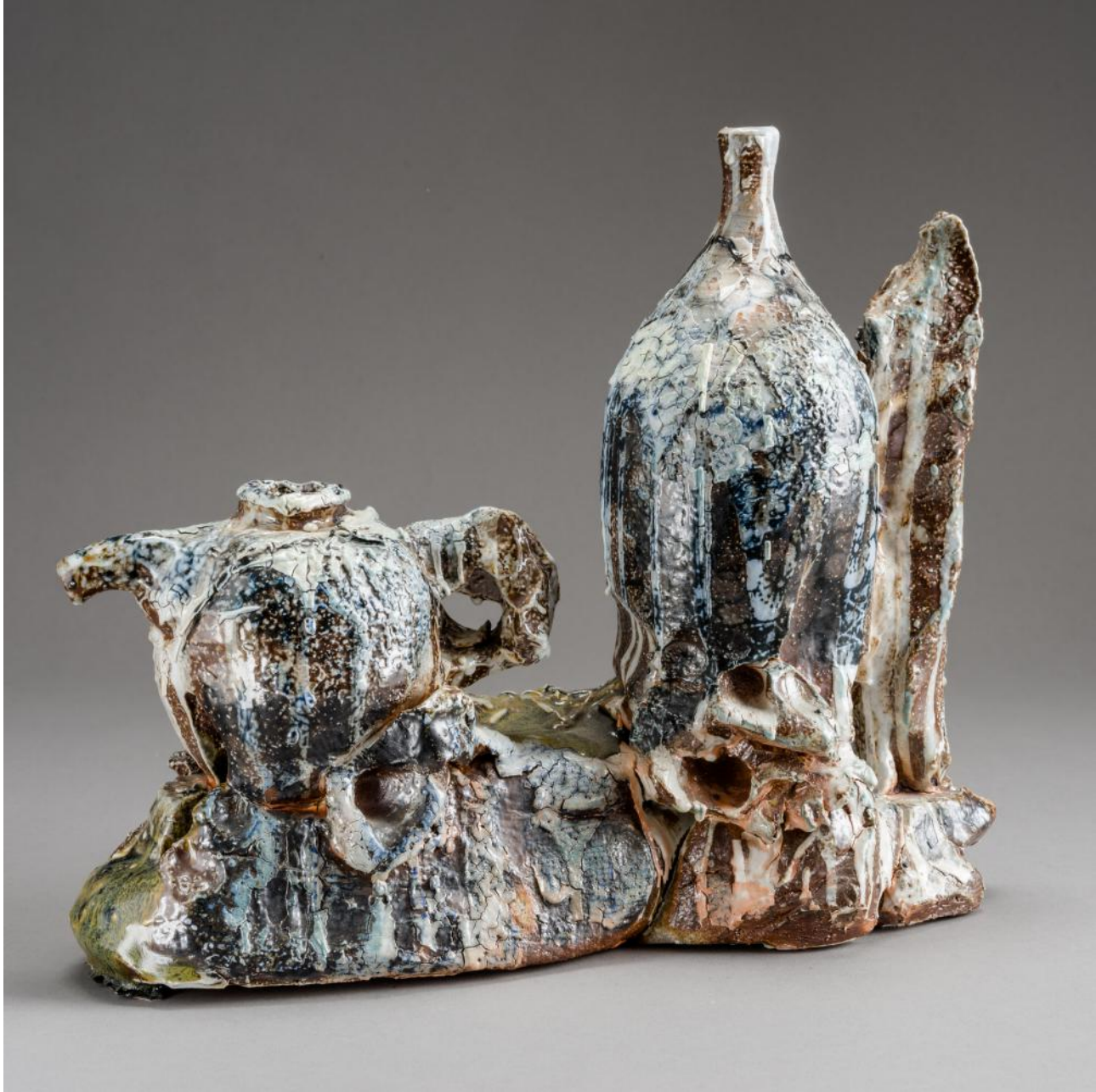
JIANGSHENG (JACKSON) LI