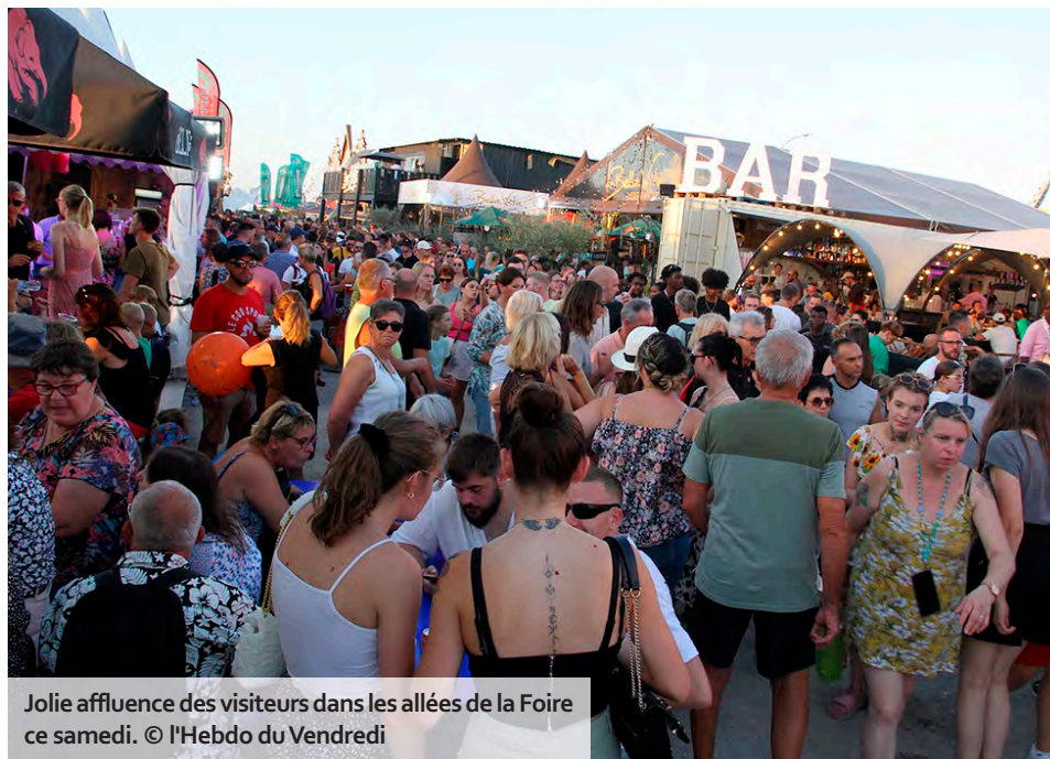
Jolie affluence des visiteurs dans les allées de la Foire ce samedi.