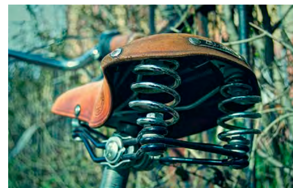
Les engins sont à déposer dans les déchetteries de Pierry et Voivreux.

Dans le cadre de sa politique de réduction des déchets et de la Semaine européenne du développement durable, Épernay agglomération Champagne organise une collecte de vélos, dans deux déchetteries de son territoire. Ainsi, du samedi 16 septembre au dimanche 8 octobre, les usagers pourront déposer des vélos dont ils n'ont plus l'utilité dans les déchetteries de Pierry et de Voivreux (ouvertes le mardi, de 14 h à 18 h, du mercredi au samedi, de 9 h à 12 h et de 14 h à 18 h, et le dimanche, de 9 h à 12 h). Ensuite, la ressourcerie Récup'R sera chargée de recueillir les deux-roues. Ceux en excellent état seront mis en vente directement dans sa boutique de la zone commerciale de Dizy, mais d'autres seront stockés et ressortis au moment des beaux jours. En attendant de nouer un partenariat avec une structure qui pourrait réparer les bicyclettes dans son atelier d'Épernay, la Ressourcerie les commercialisera en l'état, à des prix attractifs. Le tarif des vélos pour enfant démarrera à 5 €, tandis que ceux pour adultes seront vendus entre 15 et 40 €, selon l'état.