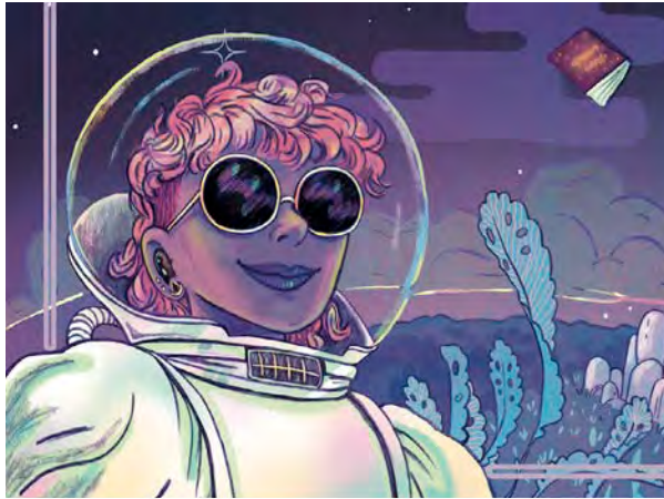
Cette 11e édition propose de découvrir le travail d'une quarantaine d'auteurs de bande dessinée.

Officiellement lancé mercredi, à l'occasion du vernissage de l'exposition « Benoît Blary, histoire(s) dessinée(s) », à découvrir à la médiathèque Jean-Falala, le Festival interplanétaire de bande dessinée de Reims (FIBD) va résonner dans différents lieux de la ville jusqu'au 23 septembre et un peu au-delà. Organisé conjointement par l'association Trac et l'Atelier 512 TTC, cet événement dédié au 9e art sera marqué par deux temps forts. Pendant les Journées européennes du patrimoine, le FIBD s'installe le samedi 16 septembre au musée de l'automobile et au