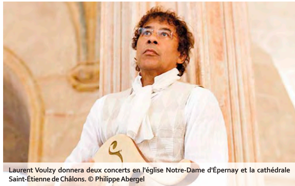
Laurent Voulzy donnera deux concerts en l'église Notre-Dame d'Épernay et la cathédrale Saint-Étienne de Châlons.

J'ai toujours eu une grande attirance pour la période du Moyen Âge, dès mon enfance. Puis pour les cathédrales, à l'adolescence. Je vivais alors mes premiers questionnements d'ordre spirituel, je m'intéressais aux choses invisibles, ésotériques.