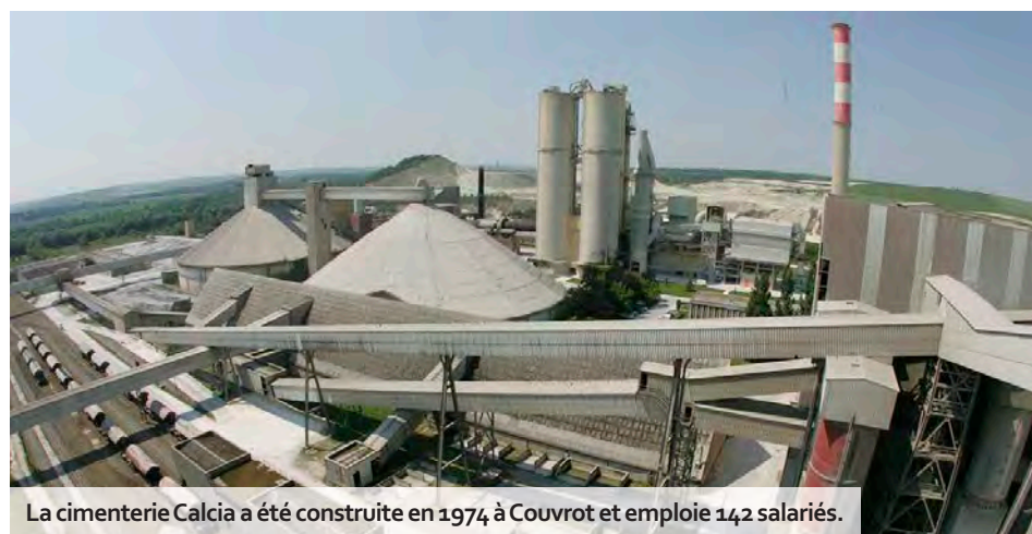
La cimenterie Calcia a été construite en 1974 à Couvrot et emploie 142 salariés.

L'usine de la cimenterie Calcia, à Couvrot, date de 1974. Elle a été bâtie sur les fondations d'un ancien site construit en 1912 et placée en 2016 sous le giron du groupe allemand Heidelberg Materials. Ce jeudi 14 septembre marquait le 9 e jour consécutif de grève des salariés. « 106 suivent le mouvement sur 142, précisent les délégués CGT du personnel. La production est à l'arrêt, faute de main-d'œuvre pour faire fonctionner le four, qui reste notre principal outil de travail. On a modifié le préavis mardi pour passer en durée illimitée. Et on sera sans aucun doute encore en grève la semaine prochaine. On ne nous laisse pas le choix. » En cause, un climat social interne que les représentants jugent « délétère » et l'absence de dialogue avec la direction. « Ils ont un comportement d'un autre siècle et nous traitent comme du bétail, dénoncent les porte-paroles. Ils nous envoient tous les jours un huissier pour faire constater