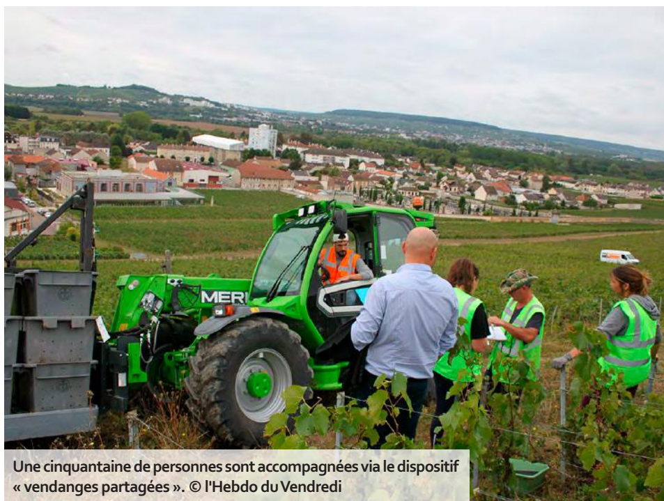
Une cinquantaine de personnes sont accompagnées via le dispositif « vendanges partagées ».

Afin de lutter contre l'exclusion des publics les plus fragiles, le Club de prévention d'Épernay a imaginé un concept qui permet, cette année encore, à une cinquantaine de Sparnaciens de retrouver le chemin de l'emploi dans les vignes.