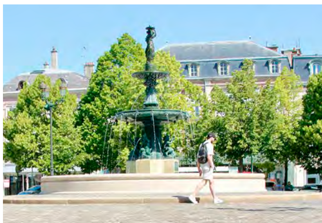
Les répondants ont un ressenti général « moyennement favorable » de la marche à Épernay.

L'indicateur global de 8,8 sur 20, soit un « D » pour un ressenti général « moyennement favorable », est similaire à celui de l'an passé (9 sur 20). Le jugement des usagers est assez sévère dans chacune des catégories : ressenti global (9,7), sécurité (9,6), aménagements (9,4), confort (8,4) et surtout efforts de la ville (7,1). Une notation qui peut être relativisée eu égard au faible nombre de répondants. En tout, 70 000 participants ont été recensés dans la France entière, permettant de noter plus 230 communes de toutes tailles. Le collectif se félicite « du succès de cette 2e édition » permettant donc d'augmenter le nombre de villes intégrées dans son baromètre, mais il estime que « les résultats demeurent très insatisfaisants au vu des attentes de nos concitoyens ». En effet, la note nationale moyenne est de 9,2 sur 20 en ce qui concerne le ressenti global des usagers.