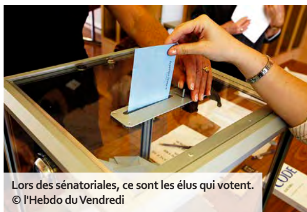
Lors des sénatoriales, ce sont les élus qui votent.