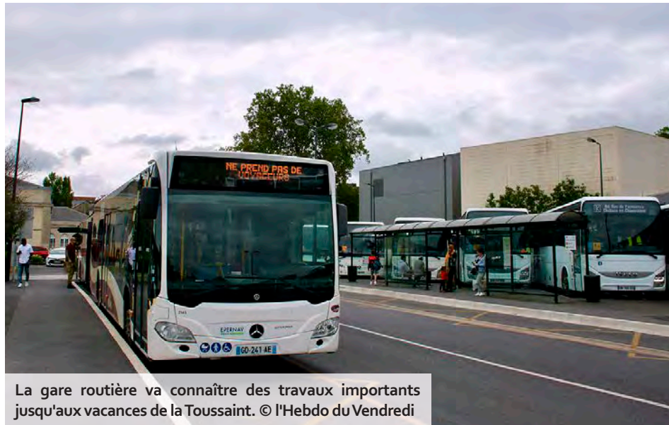
La gare routière va connaître des travaux importants jusqu'aux vacances de la Toussaint.

Ce premier chantier démarrera dans les prochains jours puisque la préparation des travaux doit débuter à partir de la deuxième moitié du mois de septembre. Ensuite, les engins et les ouvriers sont attendus à l'endroit même où se trouve l'actuel lieu de rassemblement des cars et des bus, sur la place de la Gare, située à l'arrière du cinéma Le Palace, à partir du 9 octobre. Ce chantier de-