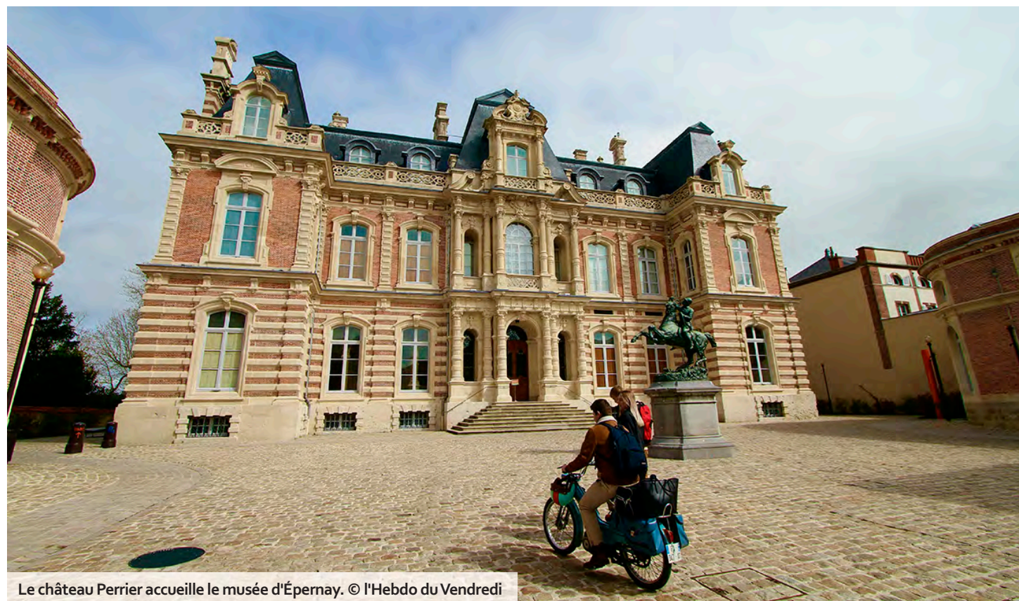
Le château Perrier accueille le musée d'Épernay.

Afin de valoriser ses paysages splendides et de promouvoir le tourisme dans la région, la communauté de communes de la Grande Vallée de la Marne (CCGVM) a récemment aménagé huit points de vue dans autant communes du territoire : Ambon-