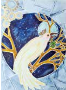
HEILKRAFT DER FARBEN