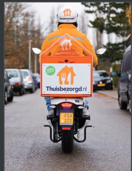
Isotherme avec double parois

ENGELS serving logistics and the environment