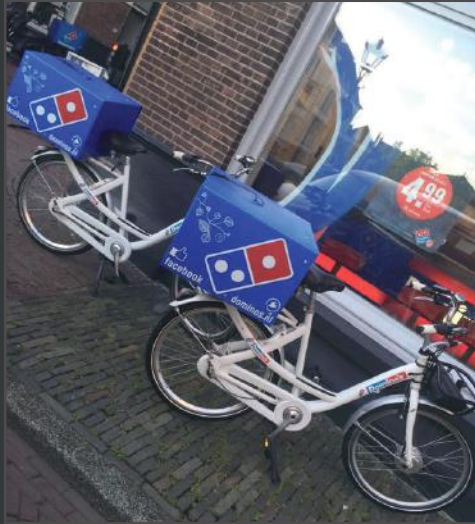
En polypropylène alvéolaire ultra léger