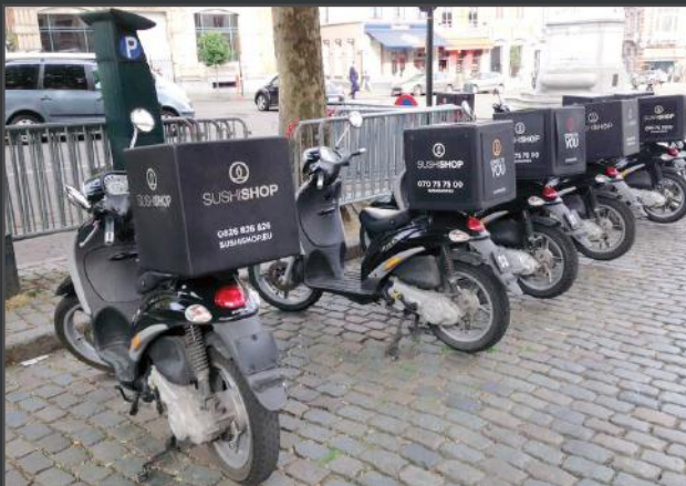
En simple parois et robuste