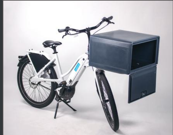
En plastique léger