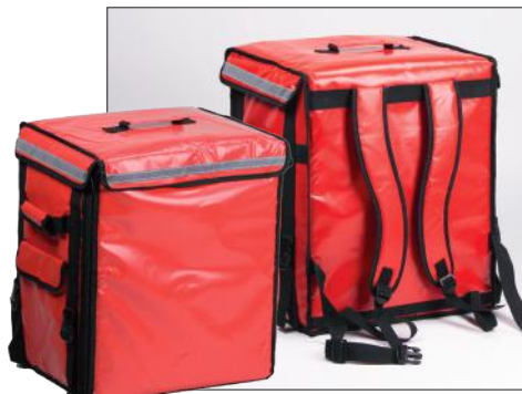
Sac à dos isotherme avec étagères ajustables.

Il est de plus en plus difficile de trouver des collaborateurs ayant un permis scooter, car les jeunes peuvent rouler en conduite accompagnée dès l'âge de 17 ans. Pour pallier ce problème, Engels a mis au point une Bicycle Delivery Box (boîte de livraison pour vélo). Des jeunes peuvent ainsi distribuer des marchandises à vélo.