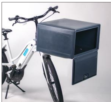
Caisson léger pour le support de devant pour vélo.

Grace à notre propre bureau d'études et production nous pouvons vous fabriquer facilement votre propre caisson de livraison en polypropylène alvéolaire sur mesure.