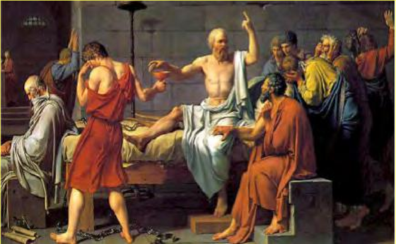
Pintura creada por el artista francés Jacques-Louis David, su nombre es Muerte de Sócrates (1787).

lo ponía cara a cara ante ellos: la Filosofía. No sorprende, que, al verse con demasiada frecuencia movido por los avances tecnológicos, por los inmensos medios de comunicación y de entretenimiento, haya dejado ya de ver atractiva su propuesta. Y, ¿en qué consiste tal? Nada menos que en que volvamos a pensar; y, sobre todo, que lo hagamos de la mejor forma posible, cosa que sólo lograremos en la medida que entendamos la realidad en su conjunto.