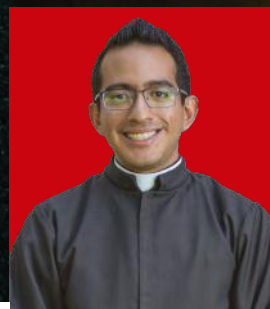
Por Daniel Francisco Tapia Lira