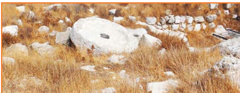
חורבת כעכול - שרידי בית בד

גדליה, או בשמו המלא, גדליהו, היה בן למשפחה עמידה בירושלים של סוף ימי הבית הראשון. סבו של גדליהו, שפן, היה סופר המלך יאשיהו (639-609 לפנה"ס). סופר המלך היה פקיד חשוב בבית המושל בימים עברו. אחיקם אביו של גדליהו היה שר בממשלתו של יאשיהו. בין הפרשיות היותר מפורסמות אודות אביו, ידוע שהציל את ירמיהו הנביא ממות. העם לא ממש אהב את דברי ירמיהו שניבא נבואות חורבן והרס ומשום כך זממו להוציאו להורג. אחיקם מנע זאת כפי שמוזכר בתנ"ך: "אך יד אחיקם בן שפן היתה את ירמיהו לבלתי ית אתו ביד העם להמיתו" (ירמיהו כו כד). באוירה זו גדל גדליהו באותם ימים.