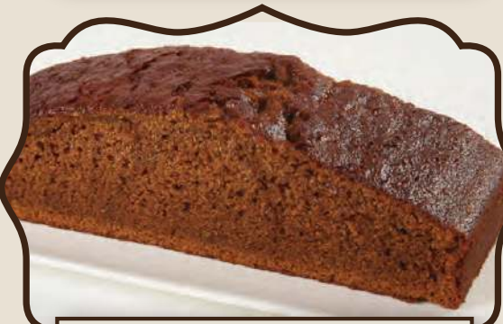
עוגת דבש פרווה