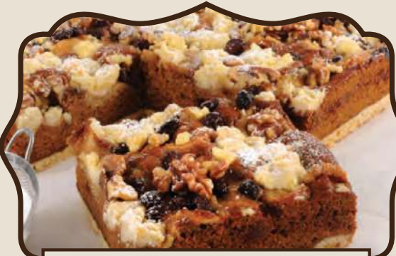
פלטת קרמבל תפוחים בדבש