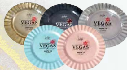
סט צלחות VEGAS