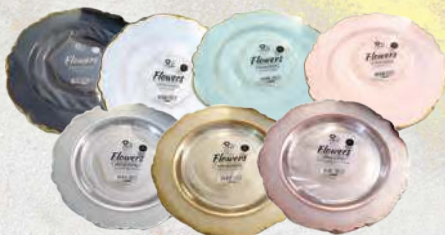
סט צלחות Flowers