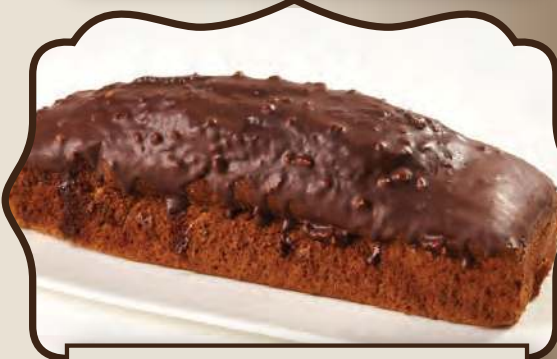
עוגת דבש פרווה

לפרטים והזמנות: 073-7437467 רח' רחמילביץ' 130, פסגת זאב