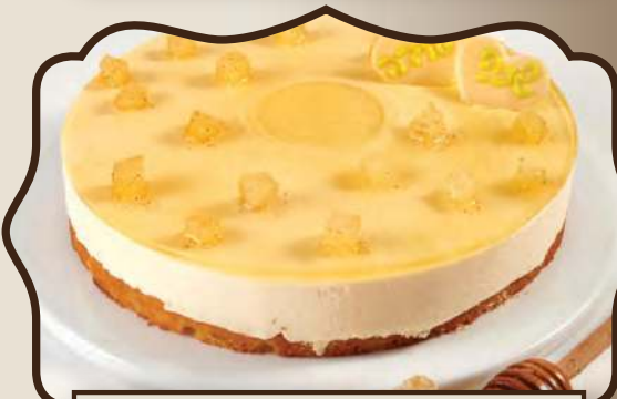
מוס פנקוטה דבש ומנגו