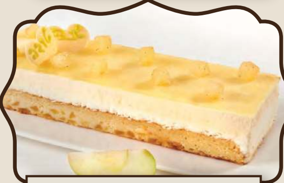
מוס פנקוטה דבש ומנגו