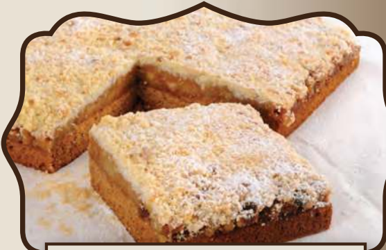
פלטת תפוחים בדבש ופירורים