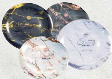
סט צלחות FANCY