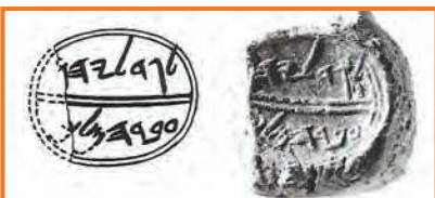
גדליהו עבד המלך - חותם עם שמו של גדליה אולי בן אחיקם - מקור - נחמן אביגד, בולות עבריות מימי ירמיהו

גדליה, או בשמו המלא, גדליהו, היה בן למשפחה עמידה בירושלים של סוף ימי הבית הראשון. סבו של גדליהו, שפן, היה סופר המלך יאשיהו (639-609 לפנה"ס). סופר המלך היה פקיד חשוב בבית המושל בימים עברו. אחיקם אביו של גדליהו היה שר בממשלתו של יאשיהו. בין הפרשיות היותר מפורסמות אודות אביו, ידוע שהציל את ירמיהו הנביא ממות. העם לא ממש אהב את דברי ירמיהו שניבא נבואות חורבן והרס ומשום כך זממו להוציאו להורג. אחיקם מנע זאת כפי שמוזכר בתנ"ך: "אך יד אחיקם בן שפן היתה את ירמיהו לבלתי ית אתו ביד העם להמיתו" (ירמיהו כו כד). באוירה זו גדל גדליהו באותם ימים.