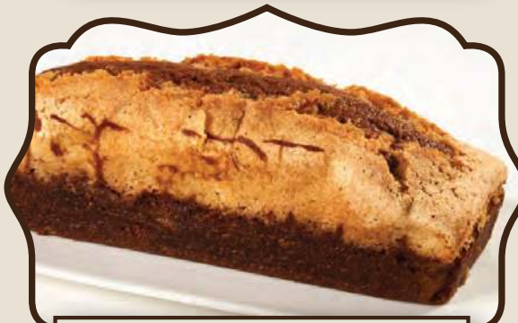
עוגת דבש ומרנג שקדים