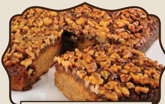
פלטת דבש אגוזים בקרמל