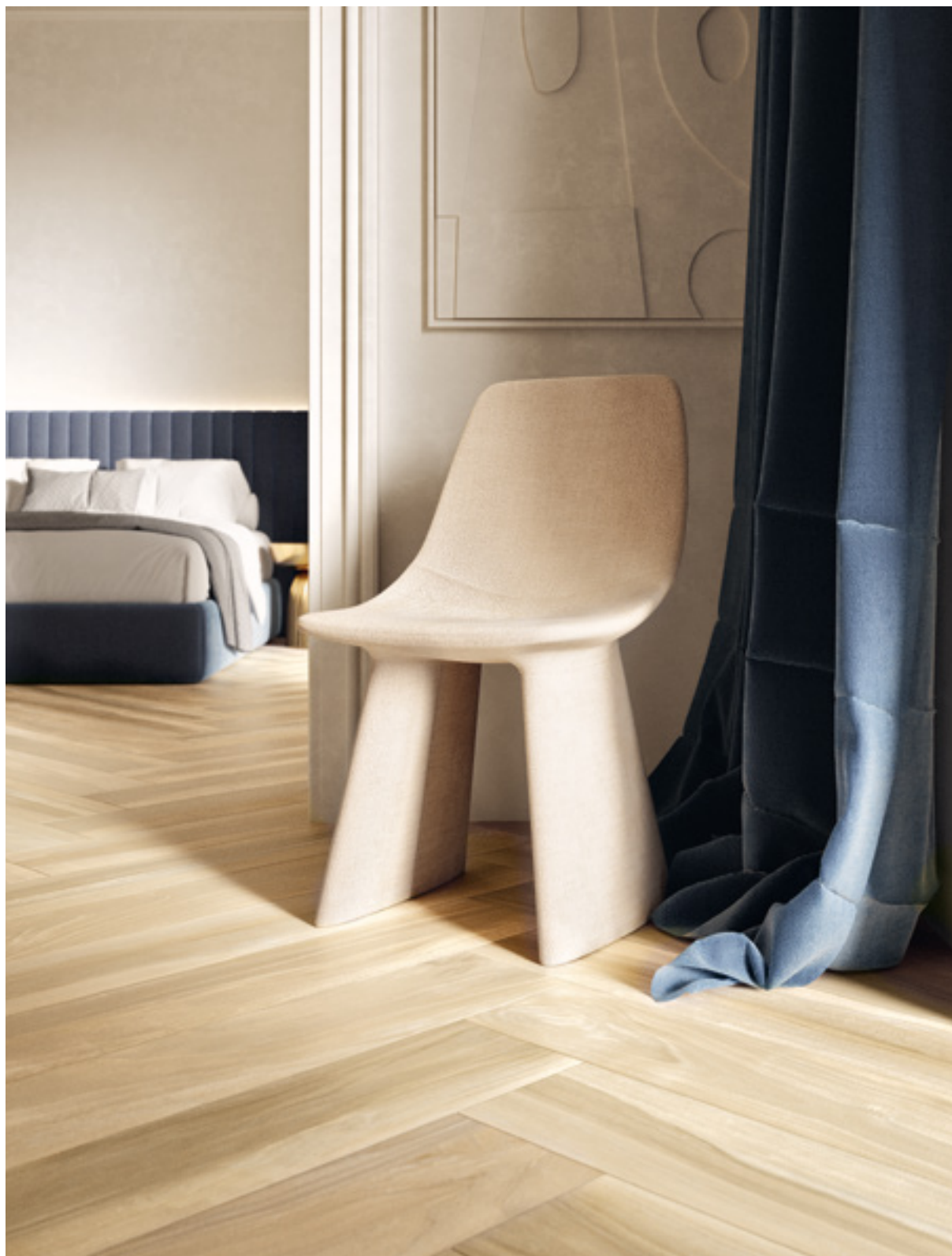
Tabula XL Miele 20x120 / 7,9"x47,2"

> Tabula XL Cenere Naturale 20x120 / 7,9"x47,2"