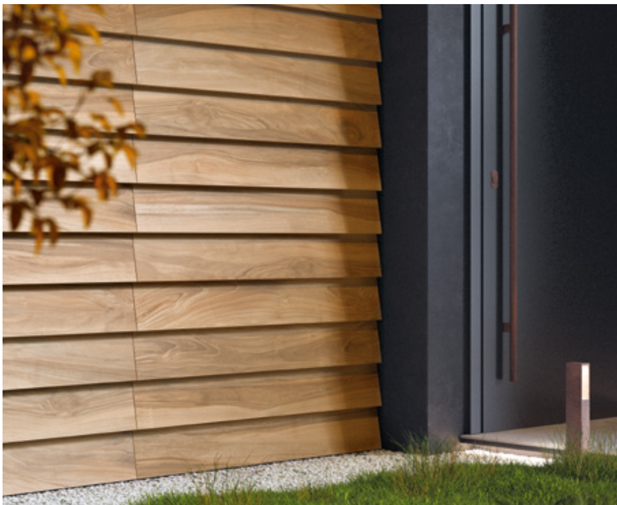
Tabula XL Noce Out Dry R11 20x120 / 7,9"x47,2"