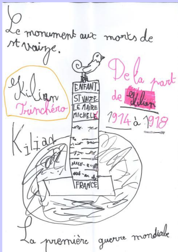
Le dessin du jeune Kilian, 6 ans 1/2