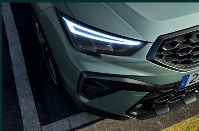
Full projecteurs LED avec réglage dynamique de la portée des phares