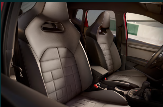
Sièges baquets sport et sièges chauffants