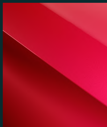
LIMINAL** special Fr. 800.-