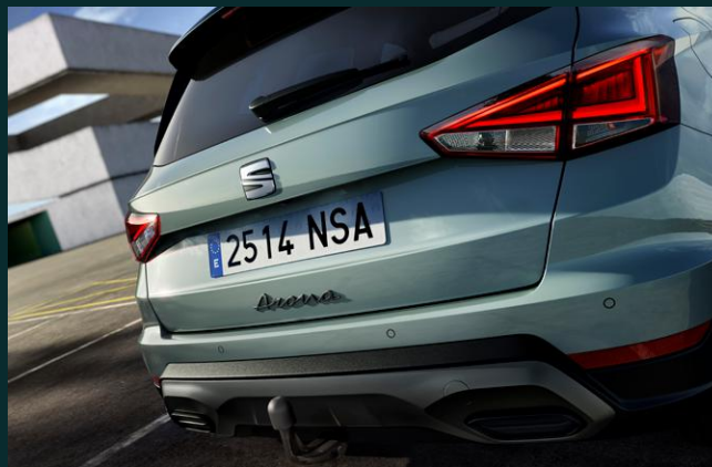
Aide au stationnement avant et arrière avec caméra de recul