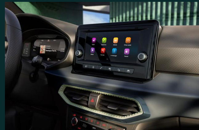
SEAT FULL LINK avec Apple Car Play & Android Auto