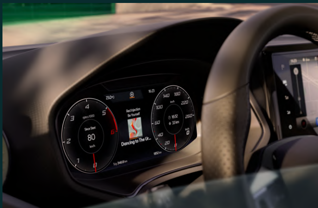
10.25" Digital Cockpit