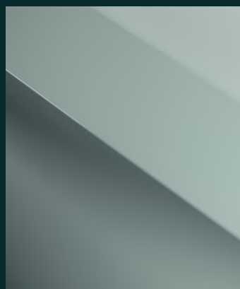
ONIRIC special Fr. 800.-