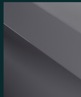
GRAPHENE GREY special Fr. 850.-