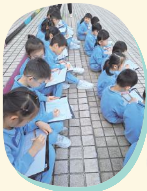
尖沙咀海濱長廊寫生活動

K.3 幼兒於本年度透過參觀氣候變化博物館、科學館及到尖沙咀海濱長廊遊覽及寫生等的體驗式學習活動，理解氣候變化的影響，以培養愛護環境的意識；從探索科學與生活的關係，領略科學的奧秘；從遊覽及寫生活動，增強觀察力並發展美感能力。