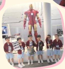
參觀賽馬會氣候變化博物館