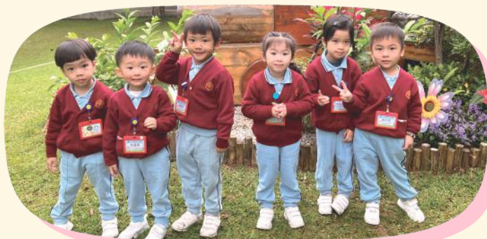
參觀大埔海濱公園

「參觀香港鐵路博物館」和「參觀大埔海濱公園」活動讓K.1幼兒能從實地參觀，認識有關鐵路交通的特色及不同的鐵路交通工具的外型；從親身到公園觀察及探索，認識公園裏不同的設施，從而提升幼兒對身邊事物的好奇心，及培養幼兒喜歡觀察、探索及愛護身邊事物態度。