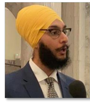
ਸ੍ਰ. ਯੁਵਰਾਜ ਸਿੰਘ