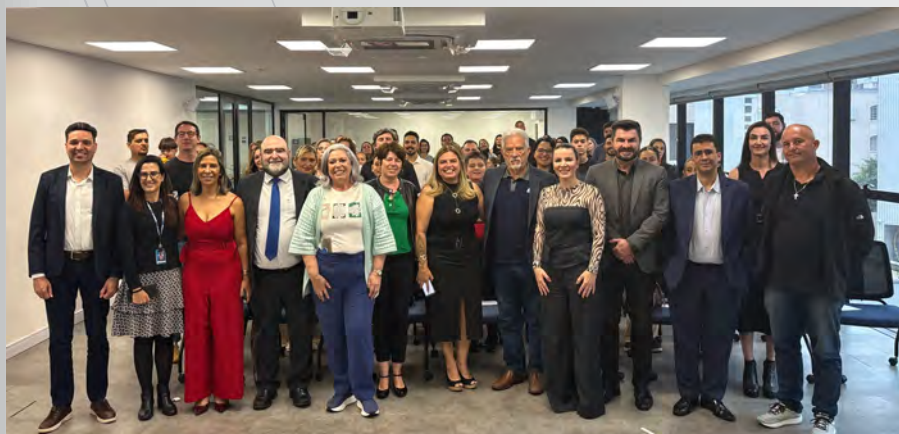
Agepar na Escola encerra primeiro ano com adesão de mais de 5 mil alunos