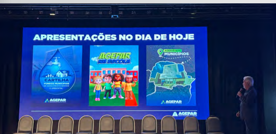
Agepar presente na 11ª Assembleia Geral das Microrregiões de Água e Esgotamento Sanitário