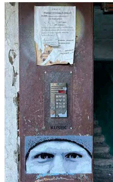
Le visage d'un anonyme, dans les ruines de Borodianka.