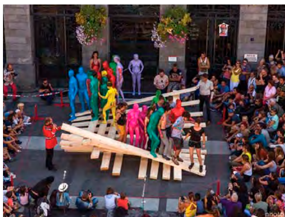
Le spectacle participatif du Cirque Inextremiste, programmé samedi et dimanche au lac du Der.

Autres écrans investis par le festival itinérant : le mémorial des batailles de la Marne à Dormans (musique classique), Trois-Fontaines-l'Abbaye (théâtre de rue), l'orangerie du château de Montmirail (cirque), les archives départementales de Châlons (théâtre et humour), la halle de Lagery (musiques actuelles) ou encore la salle panoramique du champagne Nicolas Feuillatte à Chouilly (musiques de films et classique). Bel été indien en perspective !