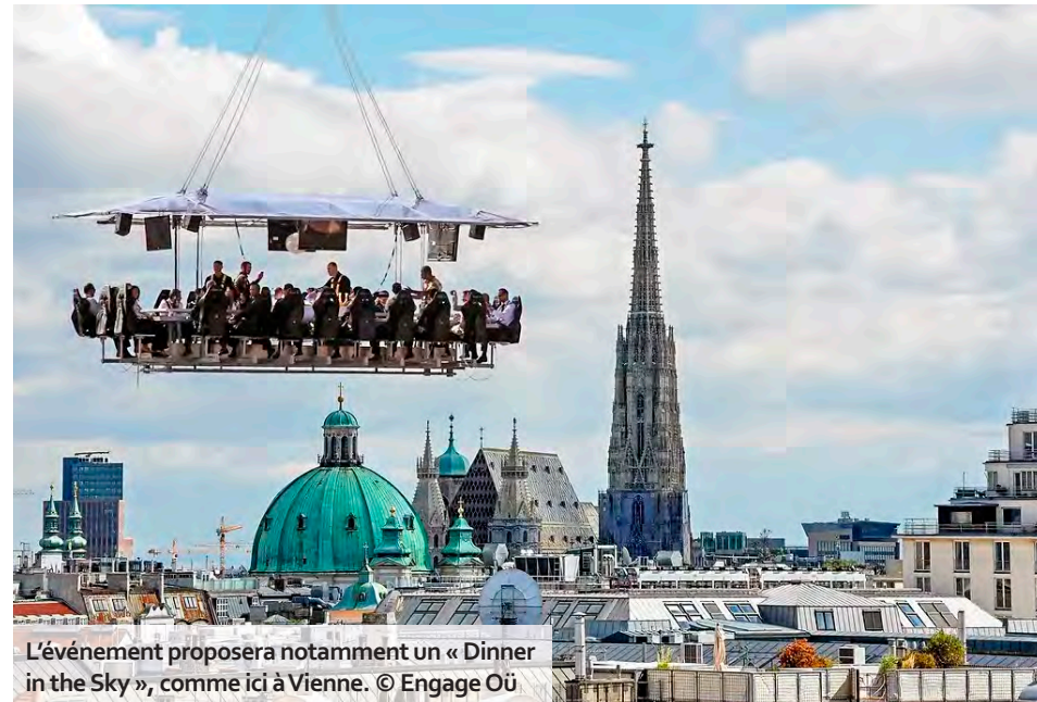
L'événement proposera notamment un « Dinner in the Sky », comme ici à Vienne.

Profitant des Journées européennes du patrimoine, un parcours entre la colline Saint-Nicaise et le quartier du Boulingrin célèbrera le patrimoine culturel et culinaire de Reims. Chefs, artisans, producteurs et vignerons proposeront des rendez-vous gustatifs lu-