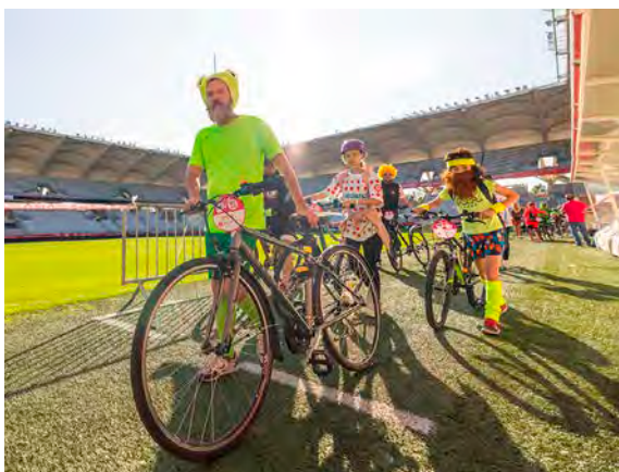
Il sera à nouveau possible de traverser le stade Auguste-Delaune, via une boucle optionnelle.

Un programme chargé, qui nécessitera de mettre régulièrement pied à terre, mais accessible à tous les cyclistes, qu'ils soient pratiquants réguliers ou non. Ils sont d'ailleurs déjà nombreux à avoir en poche leur billet payant (12 € et 7,50 € pour les moins de 12 ans), puisque les départs entre 9 h et 11 h sont déjà complets. Selon les organisateurs, les deux derniers créneaux devraient trouver preneur avant dimanche matin, où un grand soleil est attendu sur la cité des sacres.