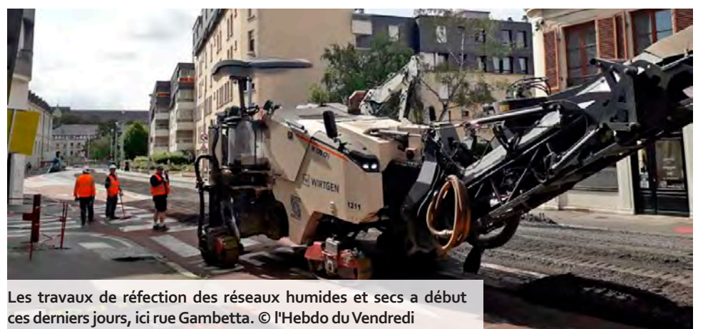
Les travaux de réfection des réseaux humides et secs a débuté ces derniers jours, ici rue Gambetta.