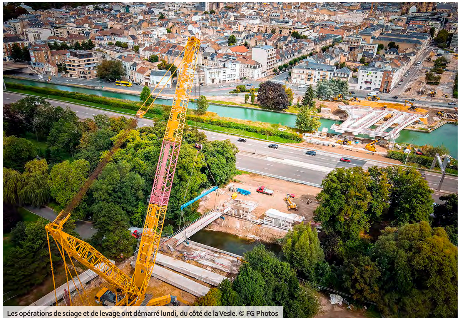
Les opérations de sciage et de levage ont démarré lundi, du côté de la Vesle.

Cette fameuse grue est entrée en action lundi après-midi. Après la découpe des éléments composant les restes du pont à l'aide d'une scie à câble diamanté, ces poutres géantes de béton ont été déposées par levage sur la plateforme adjacente. Un spectacle impressionnant, mais finalement assez lent, au grand dam des vidéastes