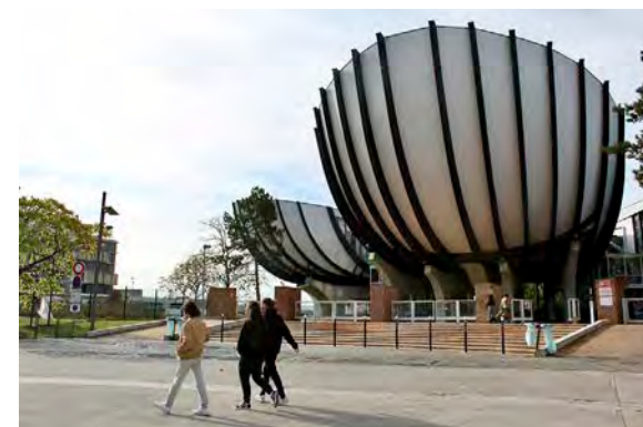
Le STAPS rejoindra le campus Croix-Rouge à partir de septembre.

Le déménagement se déroulera en trois phases. Si les DEUST, licences, licences professionnelles, et le master ingénierie et ergonomie de l'activité physique débiteront initialement dans le bâtiment 25 du campus Moulin de la Housse, dès le mois de septembre, les enseignements du master management du sport démarreront sur le campus Croix-Rouge. Puis, à partir de novembre 2024, les activités de recherche et les travaux pratiques seront transférés. Enfin, à compter de janvier 2025, c'est l'ensemble de l'UFR Staps qui rejoindra son nouveau site.