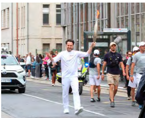
Châlons s'apprête à revivre la ferveur du passage de la flamme (en photo, l'olympique, le 30 juin).