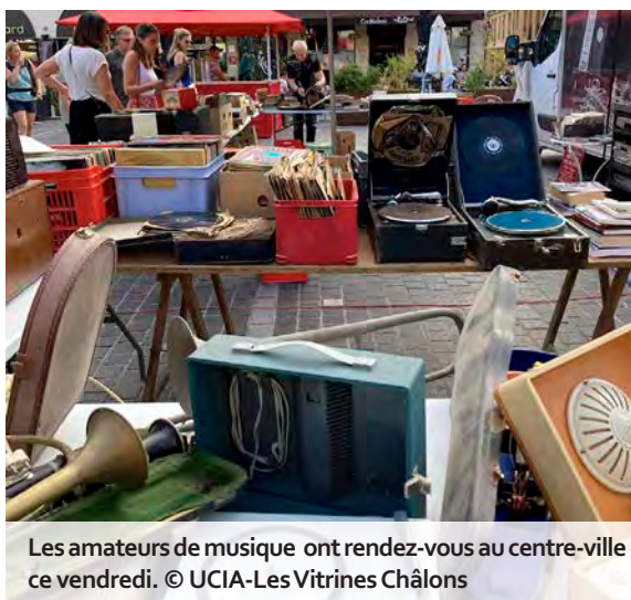
Les amateurs de musique ont rendez-vous au centre-ville ce vendredi.

C'est un rendez-vous qui a clairement trouvé son public au centre-ville de Châlons. Pour la 4e année consécutive, la brocante musicale nocturne que chapeaute l'UCIA-Les Vitrines s'installe, ce vendredi, place de la République. Elle s'agrémentera cette fois encore d'une bourse aux livres, toutes époques et tous genres confondus. Au total, près d'une vingtaine d'exposants professionnels et particuliers, marmais pour la plupart, débelleront leurs précieuses collections pour l'occasion : des ouvrages et des vinyles par centaines bien sûr, mais aussi des CD et K7, des pochettes d'albums, des instruments et des partitions, des affiches de concerts, du matériel de sonorisation et peut-être même des platines ou des chaînes hifi anciennes. « Quelques emplacements restent encore disponibles, précise Pauline Blanc, animatrice des Vitrines de Châlons. Ceux qui souhaitent exposer peuvent nous contacter, y compris vendredi. » La place sera entièrement investie par l'événement, avec interdiction d'y stationner dès le début d'après-midi. « Nous avons également proposé aux bars du secteur d'installer une partie buvette en extérieur. L'idée, c'est de faire venir du monde en cœur de ville et sur les terrasses. » Nouveauté cette année grâce à la complicité du Red Fish, la brocante et la bourse accueilleront l'orchestre de variétés Feeling, bien connu en Châlonnais pour ses reprises musicales enjouées.