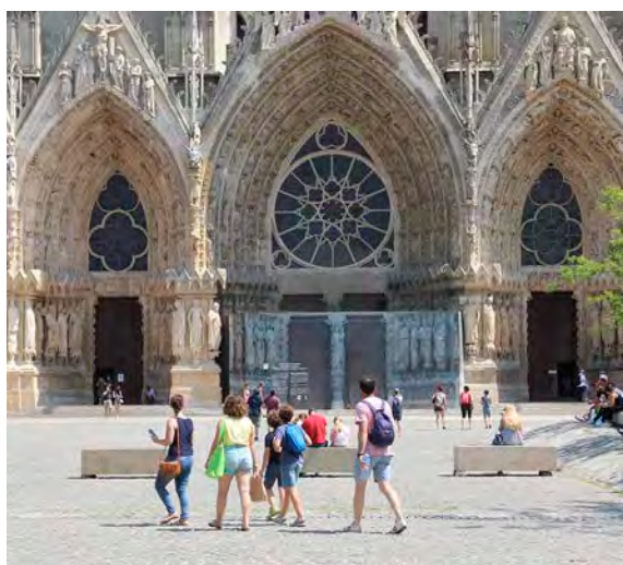
Deux séances photos seront organisées le 26 août, à Reims et Épernay.

Pour participer à l'une de ces séances, il est nécessaire de s'inscrire au préalable sur le site www.grandest.fr/devenez-ambassadeur . Outre le fait de représenter son territoire et d'en devenir l'un de ses ambassadeurs, c'est l'opportunité pour chaque participant de repartir avec de très belles photos, mais aussi d'être invité à partager sa vision du Grand Est « afin d'enrichir les actions de la région ».