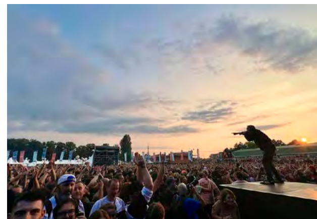
La dernière journée a affiché complet avec 32 000 spectateurs.

Cette 18e édition achevée, le Cabaret Vert peut se tourner sereinement vers 2025 animé par l'envie de proposer encore et toujours une meilleure expérience à ses festivaliers.