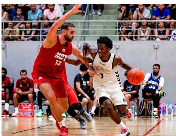
Totalemment dépassée à Nancy, l'union marnaise doit montrer un autre visage face à Bruxelles et Rouen.

Les trois derniers tests se joueront tous à l'extérieur : à Bruxelles (BNXT League), le samedi 31 août, à Charleroi (BNXT League), le dimanche 1er septembre, et à Gries-Souffel (Pro B), le samedi 7 septembre.