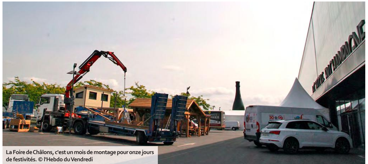
La Foire de Châlons, c'est un mois de montage pour onze jours de festivités.

Ce mardi, au commissariat général, les équipes de l'UCIA étaient en plein rush : accueil et renseignements des exposants, standard téléphonique, gestion des badges d'accès, envoi de plusieurs milliers d'invitations officielles, etc. « Il arrive qu'on nous pose des questions assez surprenantes, glisse l'une des salariées. Est-ce qu'on propose une garderie pour les enfants pendant telle ou telle conférence, par exemple, ou est-ce qu'on vend du matériel pour nettoyer les stands. Dans ce cas, on les oriente vers la grande surface la plus proche ! » Certains professionnels tentent – en vain – de gagner quelques mètres carrés sur les espaces déjà réservés. D'autres se font livrer des colis au Capitole. Et pour cause, ils vont pour ainsi dire « vivre ici » pendant deux semaines. Dans les allées comme dans les halls, les « petites mains » fourmillent et le ballet des engins