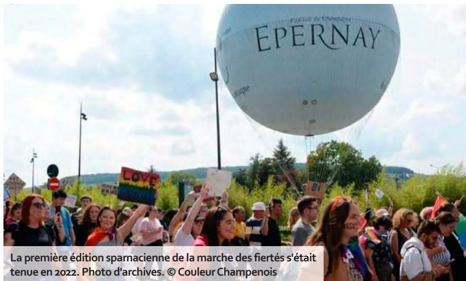
La première édition sparnacienne de la marche des fiertés s'était tenue en 2022. Photo d'archives. © Couleur Champenois

La journée se tiendra place Mendès-France, en face de la gare SNCF, dès 12 h, avec l'ouverture