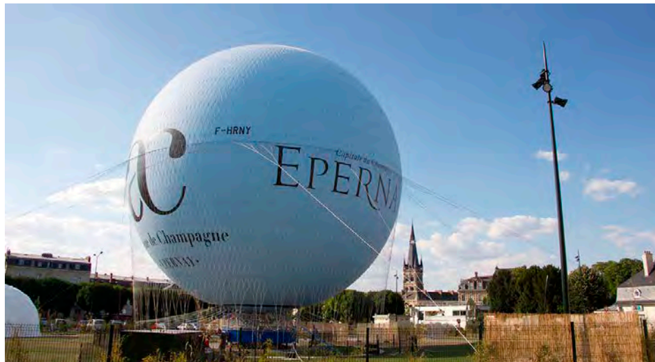
Le ballon captif peut prendre son envol au cours de la soirée avec des personnes à son bord en cas de conditions météorologiques favorables.