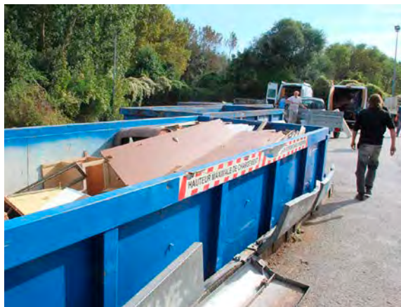
Les horaires d'ouverture des déchetteries sont susceptibles de changer en cas de fortes chaleurs. Photo d'archives. © l'Hebdo du Vendredi

A partir du 21 juin, l'ensemble des déchetteries du territoire de la Grande vallée de la Marne passent en horaires d'été. Dans la communauté de communes, les villages d'Aÿ, de Dizy, de Mareuil-sur-Aÿ et de Tours-sur-Marne sont concernés. Ainsi, à Aÿ, le lieu de traitement des déchets sera ouvert de 7 h à 13 h les mardis et les jeudis. De même pour Dizy, à la différence près que la déchetterie accueillera du public les samedis de 7 h à 13 h. Pour Mareuil-sur-Aÿ et Tours-sur-Marne, les écocentres ouvriront leurs portes respectivement quatre jours et cinq jours par semaine, toujours de 7 h à 13 h. Ce sera le lundi, le mercredi, le vendredi, et le samedi pour Mareuil-sur-Aÿ, et du mardi au samedi inclus pour Tours-sur-Marne. Pour se rendre dans une déchetterie, la communauté de communautés rappelle que la carte d'accès est obligatoire. Dernier passage possible 15 minutes avant la fermeture du centre de tri. Seuls les véhicules n'excédant pas 3,5 tonnes sont autorisés. En cas de fortes chaleurs, les horaires sont susceptibles d'être modifiés.