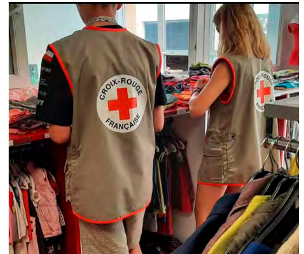
Tout le monde peut faire des achats dans la vestiboutique d'Épernay, aucune condition de ressources n'est nécessaire.

Pour rappel, aucune condition de ressources n'est nécessaire pour faire des achats. Tous les profits sont reversés afin de financer les actions sociales de la Croix-Rouge dans le bassin sparnacien.