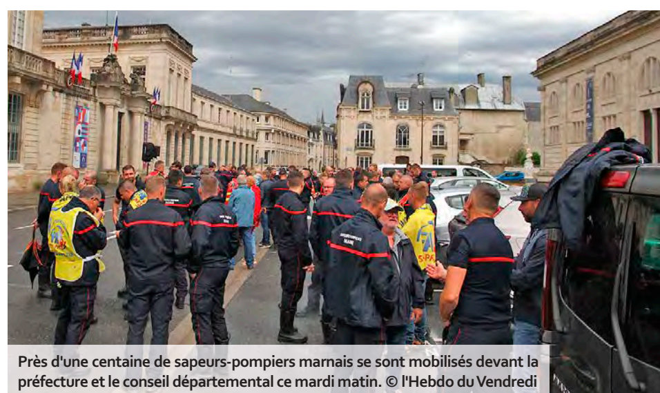
Près d'une centaine de sapeurs-pompiers marnais se sont mobilisés devant la préfecture et le conseil départemental ce mardi matin.