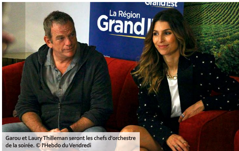
Garou et Laury Thilleman seront les chefs d'orchestre de la soirée.