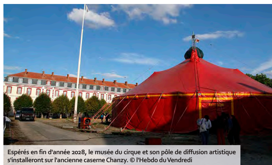
Espérés en fin d'année 2028, le musée du cirque et son pôle de diffusion artistique s'installeront sur l'ancienne caserne Chanzy.

circassiens, tant sur l'aspect de la pratique, que de la diffusion, du soutien à la création et de l'approche patrimoniale. Réunis en conseil le 13 juin dernier, les élus municipaux ont acté cette enveloppe budgétaire, dont plus de 15 M€ sont fléchés vers les travaux en tant que tels, hors muséographie et scénographie. Bien sûr, la chasse aux subventions pour co-financer une telle somme est déclarée ouverte. « Nous avons solli-