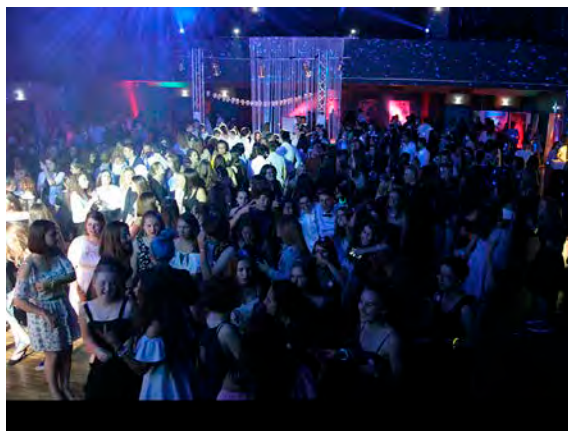
L'an dernier, 1 400 jeunes sparnaciens avaient fêté la fin de l'année scolaire à Épernay.

L'an dernier, la salle des fêtes avait fait salle comble, en accueillant pour la sixième édition de la soirée pas moins de 1 400 jeunes, et certains avaient malheureusement été refoulés à l'entrée, faute de place. Bien évidemment, la fête se fait sans alcool, ce qui permet aux jeunes d'écarter toute notion de modération à leur amusement. Les places sont en prévente depuis le 3 juin au PIJ.