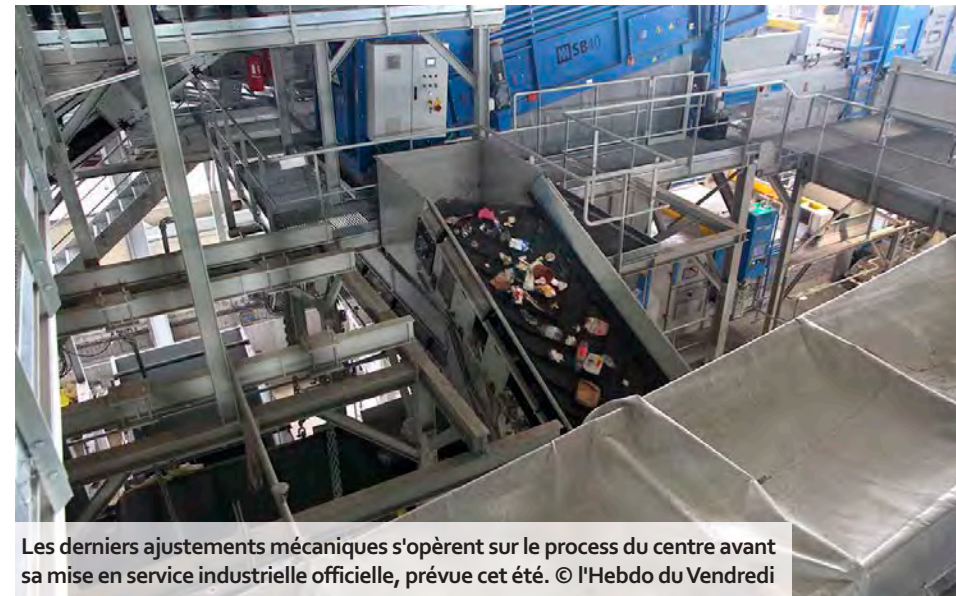
Les derniers ajustements mécaniques s'opèrent sur le process du centre avant sa mise en service industrielle officielle, prévue cet été.

tion automatique alimenté par une réserve de 1 000 m 3 d'eau et moderniser le process du centre dans sa globalité.