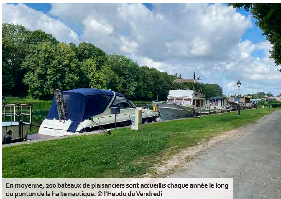
En moyenne, 200 bateaux de plaisanciers sont accueillis chaque année le long du ponton de la halte nautique.