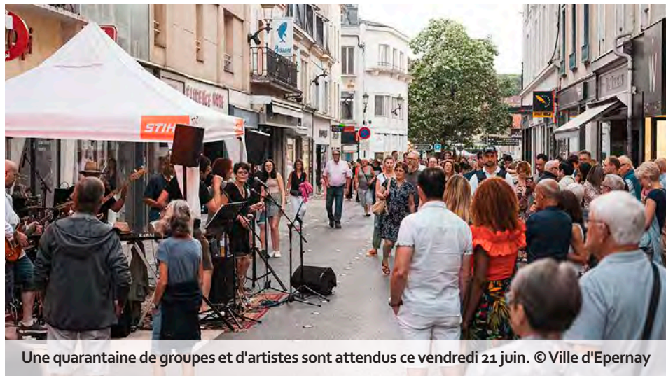
Une quarantaine de groupes et d'artistes sont attendus ce vendredi 21 juin.

Cette année, les premiers groupes vont performer dès 17 h. De 17 h à 19 h cependant, ils seront autorisés à jouer uniquement au sein de places fermées naturellement à la circulation, car le trafic routier sera interdit dans le centre-