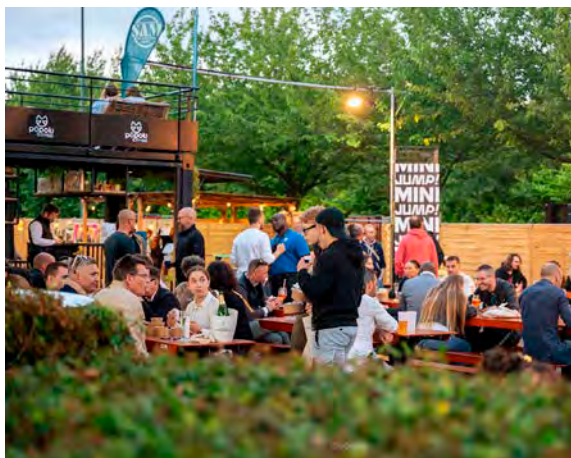
L'événement Jump !, c'est jusqu'à dimanche 23 juin.