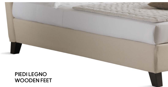
PIEDI LEGNO WOODEN FEET

+++ Indique los pies elegidos en el momento de la compra.