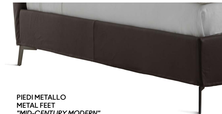
PIEDI METALLO METAL FEET "MID-CENTURY MODERN"