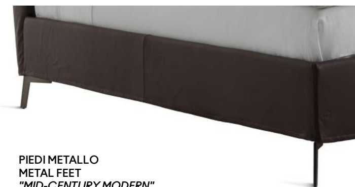
PIEDI METALLO METAL FEET "MID-CENTURY MODERN"