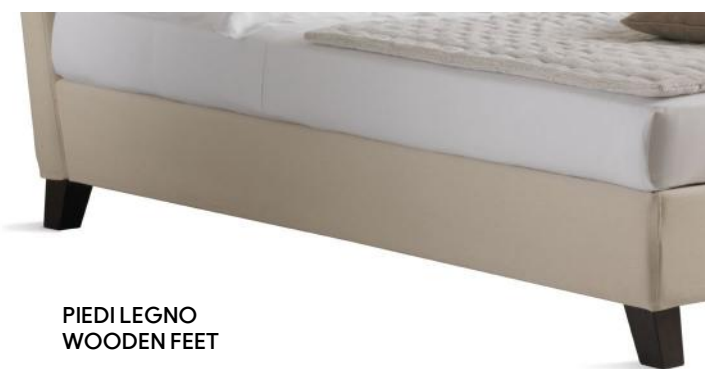
PIEDI LEGNO WOODEN FEET

+++ Indique los pies elegidos en el momento de la compra.