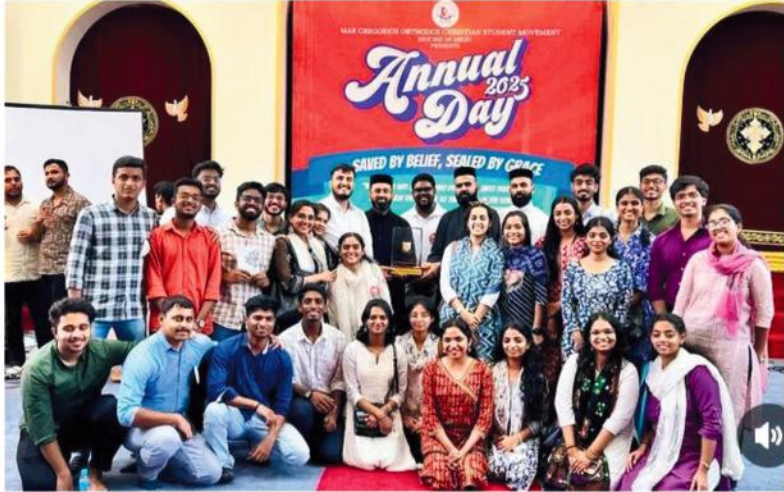
Our MGOCSM unit has been awarded the Metropolitan Special Award for the outstanding progress in 2024-25.