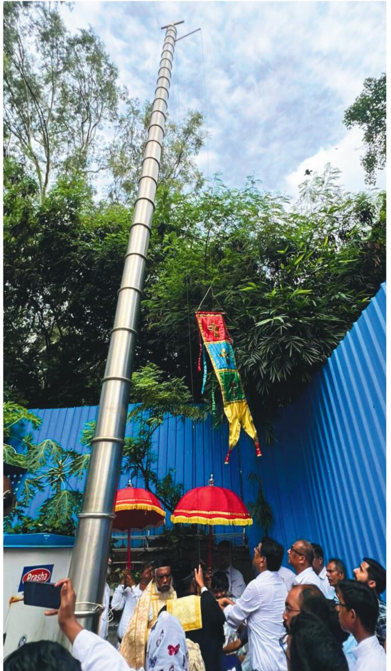
Perunnal Flag was hoisted on 10th August 2025 after the Holy Qurbana marking the onset of this years Cathedral Perunnal