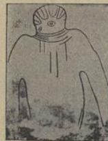
Este es el famoso «dogu» marciano de Lotbe, cuyo contrato grabado sobre la cueva del Sahara.

Fernando LATORRE Mañana, capítulo II «SU MISION ENTRE NOSOTROS»