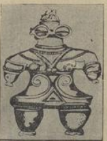
Famosas estatuillas de la isla japonesa de Hondo, cuyo parecido con la vestimenta espacial es asombroso.