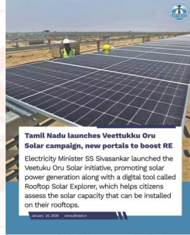
Tamil Nadu launches Veetukku Oru Solar campaign, new portals to boost RE Electricity Minister SS Sivasankar launched the Veetukku Oru Solar initiative, promoting solar power generation along with a digital tool called Rooftop Solar Explorer, which helps citizens assess the solar capacity that can be installed on their rooftops.