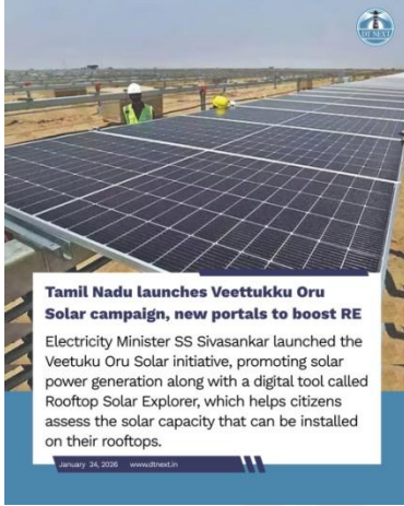
Tamil Nadu launches Veetukku Oru Solar campaign, new portals to boost RE Electricity Minister SS Sivasankar launched the Veetukku Oru Solar initiative, promoting solar power generation along with a digital tool called Rooftop Solar Explorer, which helps citizens assess the solar capacity that can be installed on their rooftops.