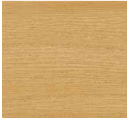
▲ 055 キャメル