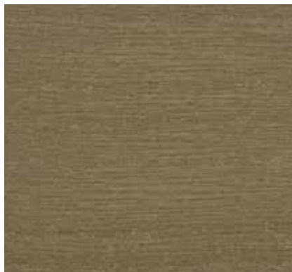
▲ 061 グレーージュ