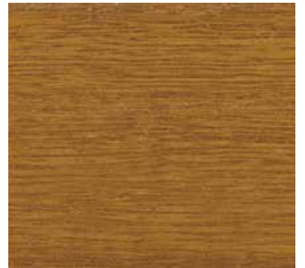
▲ 059 カフェクレーム