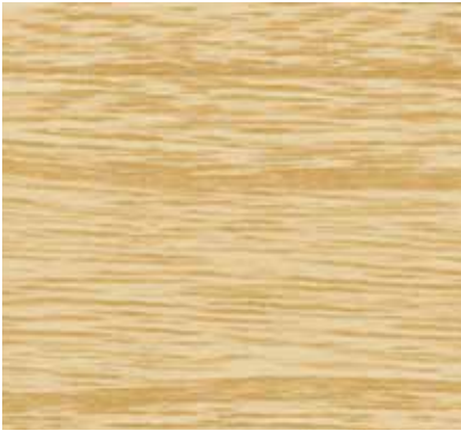
▲ 054 サブレ