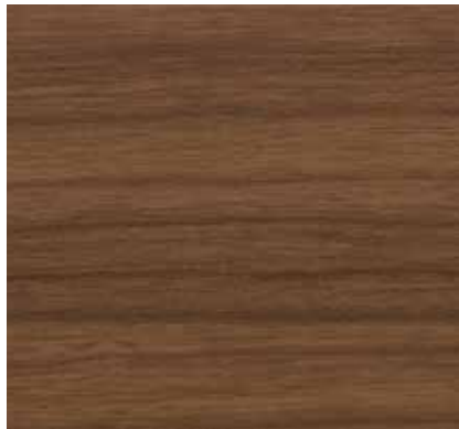
▲ 058 マロン