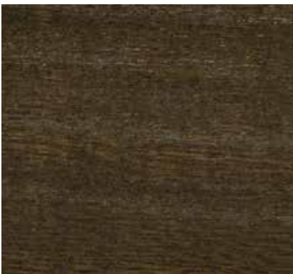
▲ 062 コーヒー