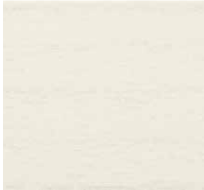
▲ 053 ライトベージュ