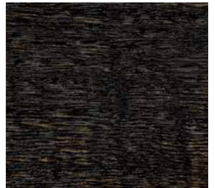
▲ 064 アイアン

色名の横に記載の(50)はスラット幅50mm対応色、(63)はスラット幅63mm対応色です。