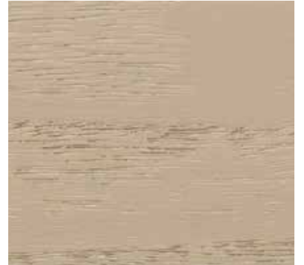
▲ 060 パティ