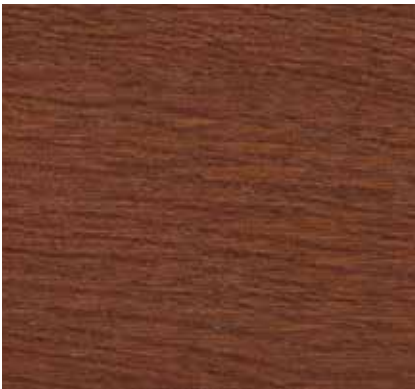
▲ 057 アズキ