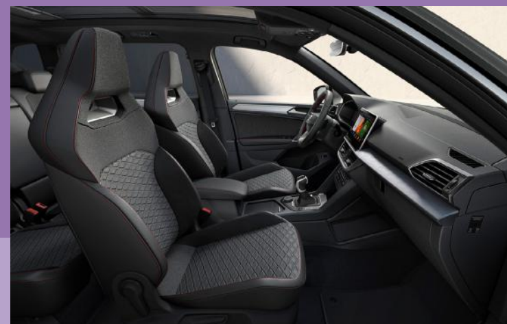
Sièges baquets sport en alcantara/tissu «noir/gris»