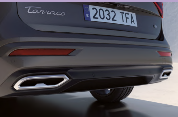
Pare-chocs sportifs FR avec diffuseur arrière noir