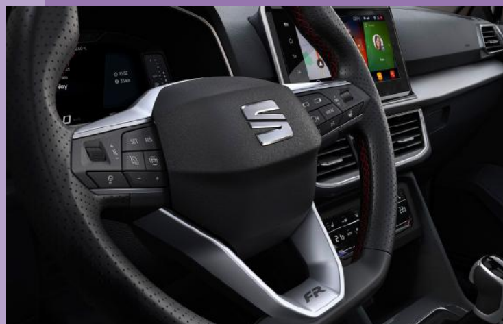
Volant sport multifonction en cuir avec logo FR