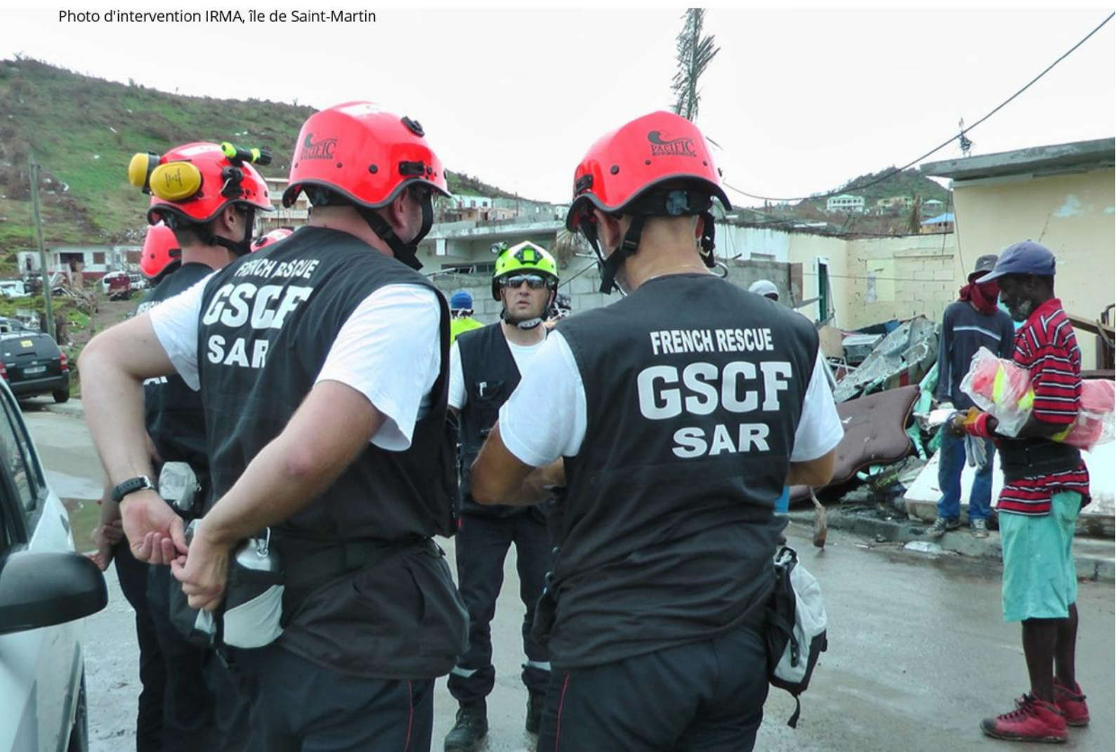
Photo d'intervention IRMA, île de Saint-Martin

Les solutions locales prennent en compte les particularités géographiques, économiques et culturelles propres à chaque région. Ainsi, elles offrent des réponses adaptées et efficaces là où les solutions globalisées peuvent parfois échouer.